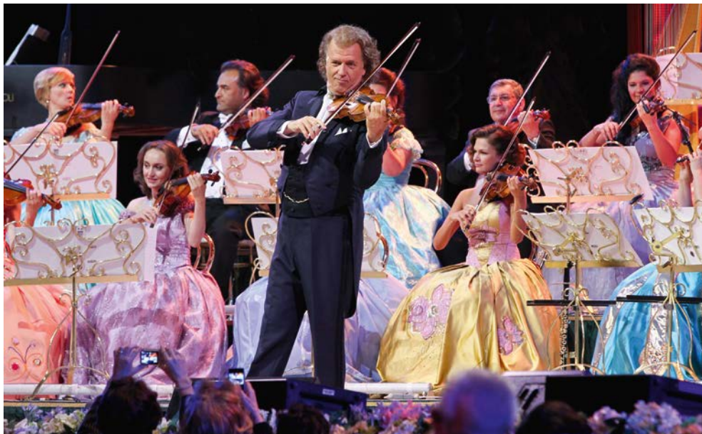
Ein fantastisches Erlebnis – das Weihnachtskonzert von und mit André Rieu