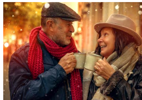
Stimmen Sie sich entspannt auf die Feiertage ein

Nach dem Frühstück und Check-Out besuchen Sie mit Ihrer Gästeführerin zum Abschluss um 11.00 Uhr das Historische Rathaus zu Aachen. Bereits an seiner Fassade lässt sich der Glanz des Gebäudes ablesen: 50 Herrscher, 31 davon in Aachen gekrönt, säumen die zentralen Figuren über dem Eingang des Rathauses: Karl der Große, Christus und Papst Leo III. Auch in den kunstvoll gestalteten Räumen wird die Geschichte des auf historischem Boden der Palastaula Karls des Großen errichteten Rathauses lebendig. Im Krönungssaal, wo einst die Herrscher nach ihrer Krönung das Mahl nahmen, erinnern heute noch Kopien der Reichskleinodien an die glanzvolle Zeit. Am 22. Januar 2019 unterzeichneten hier die ehemalige Bundeskanzlerin Angela Merkel und der französische Präsident Emmanuel Macron den Vertrag von Aachen, der eine Erneuerung der freundschaftlichen Beziehung zwischen Deutschland und Frankreich besiegelte. Gegen 13.00 Uhr treten Sie Ihre Heimreise an.