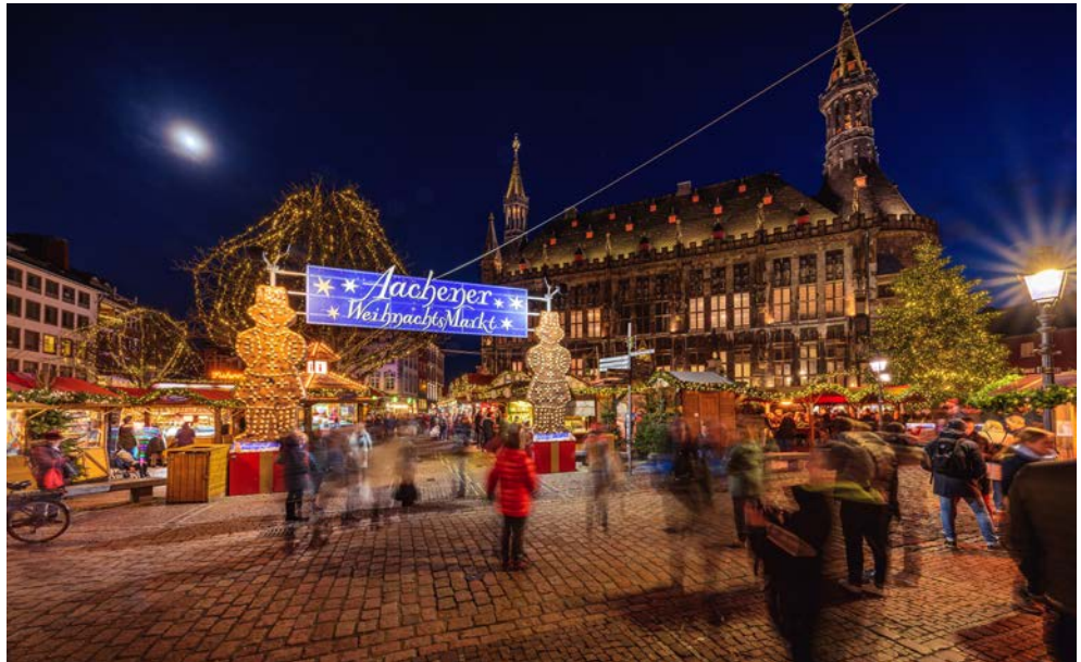
Weihnachtsmarkt in Aachen mit Blick auf das Rathaus

André Rieu ist ein musikalischer Superstar: weltweit als „Walzerkönig“ gefeiert, gehört der niederländische Star-Violinist seit dreißig Jahren zu den erfolgreichsten internationalen Spitzenkünstlern. Der charismatische Weltstar begeistert seine Fans auf fünf Kontinenten mit der perfekten Mischung aus Walzer, Filmmusik, Musical, Oper und Schlager. Jährlich besuchen rund 600.000 Zuschauer seine humorvollen, romantischen und grandiosen Konzerte. Damit übertrifft Rieu weltbekannte Künstler wie Coldplay, Elton John oder Madonna. Erleben Sie André Rieu und sein Johann Strauss Orchester bei einem zauberhaften Weihnachtskonzert in seiner Heimatstadt Maastricht. Das Konzert „Christmas with André“ wird zweifellos eines der bezauberndsten Musikereignisse des Jahres und wird Sie kurz vor Heiligabend in Weihnachtsstimmung versetzen.