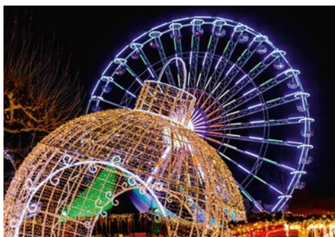
Weihnachtliche Impressionen in Maastricht

durch die geschmückte Innenstadt und lassen Sie sich durch enge Gassen treiben. Um 13.00 Uhr treffen Sie sich wieder im Hotel und die Fahrt geht in die benachbarten Niederlande ins nahe gelegene Maastricht. Unterwegs wird Ihnen Ihre Gästeführerin schon einiges zur Geschichte und den Besonderheiten Maastrichts erzählen. Angekommen, werden Sie sich mit Ihrer Gästeführerin gemeinsam auf einen Stadtrundgang begeben und sich vom vorweihnachtlichen Flair der niederländischen Stadt verzaubern lassen. Anschließend haben Sie die Möglichkeit, über den Weihnachtsmarkt zu flanieren, welcher mit dem Duft nach Krapfen, Waffeln und Maronen Kindheits-erinnerungen weckt. Stimmungsvoll illuminierte Straßen verbinden die Plätze und Höfe der historischen Innenstadt und sicherlich finden Sie hier noch ein paar Weihnachtsgeschenke, bevor Sie ein gemeinsames Abendessen gegen 17.15 Uhr einnehmen. Im Anschluss erleben Sie einen märchenhaften und unvergesslichen Abend mit dem Walzerkönig. Bereits wenn Sie den traumhaften Saal betreten, wird Sie eine Landschaft wie aus einem Wintermärchen in Weihnachtsstimmung versetzen.