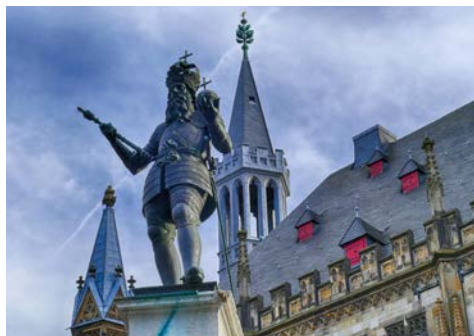
An Karl dem Großen kommen Sie in Aachen nicht vorbei

Es bleibt noch Zeit und die Möglichkeit, den Dom von innen zu besichtigen, bevor es auf den Weihnachtsmarkt geht. Er findet vor der Kulisse des historischen Rathauses und in den umliegenden Gassen statt. Aufgrund seines stimmungsvollen Ambientes ist er sehr beliebt und zieht die Aachener Bürger und Freunde