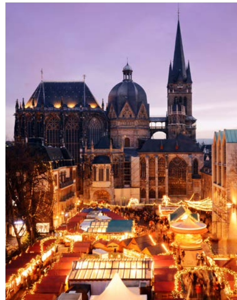
Festliche Atmosphäre in Aachen