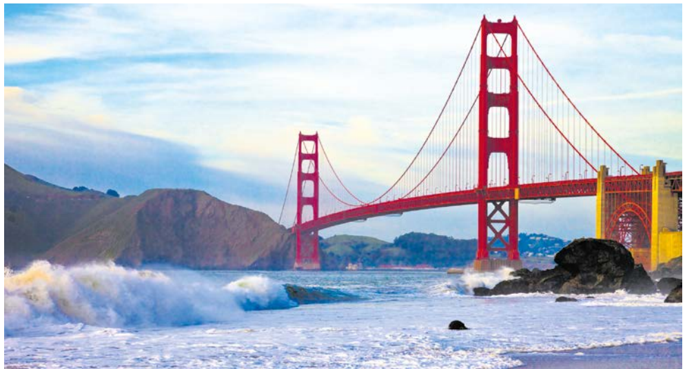
San Francisco - die berühmte Golden Gate Bridge