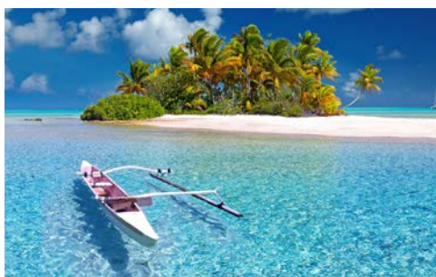
Das Paradies erwartet Sie auf Französisch-Polynesien!

Im Vitality Spa finden Sie die perfekte Entspannung und alles, was das Wellness-Herz begehrt. Shopping-Freunde kommen in zahlreichen exklusiven