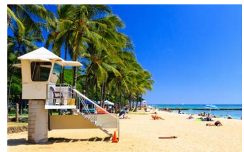
Besuchen Sie die Traumstrände Honolulu

Westküste teilweise einen wüstenartigen Charakter hat, gibt es auf der Nord- und Ostseite eine üppige Vegetation mit Ananas, Papaya, Kakao und anderen Agrarprodukten. Die Strände der Insel sind zahlreich und vielfältig – eines aber haben sie alle gemeinsam: Sie ziehen Strandliebhaber und Wellenreiter aus der ganzen Welt an. Der Waikiki-Strand ist sogar einen der berühmtesten Strände der Welt. Wunderschön ist auch der Waimea Falls Park, ein botanischer Garten mit dem einzigen leicht zugänglichen Wasserfall der Insel. In eine Plantagenlandschaft eingebettet, findet man das Polynesian Cultural Center mit nachgebauten Minidörfern aus sieben Südseeregionen. Die perfekte Kulisse für Shows mit traditioneller Kultur und Handwerk. Im Valley of the Temples befinden sich Gotteshäuser verschiedener Religionen. Sie sehen, Oahu ist eine fantastisch vielfältige Insel – da kommt eine ganztägige Inselrundfahrt genau richtig!