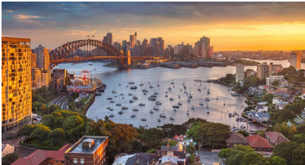
Sydney, eine Stadt, in die man sich unweigerlich verliebt!

Gruppe kulinarischer Kenner eine aromatische Reise durch fünf erlesene Gänge samt passendem Wein – alles präsentiert vom Küchenchef des Schiffs.