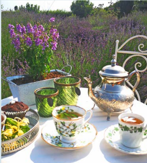
Genießen Sie eine Tasse Kräutertee im CyHerbia Garden

aus dem Schaum des Meeres geboren worden sein soll. Danach entdecken Sie die imposanten Ausgrabungen des antiken Königreiches Kourion mit seinen wunderschönen Mosaiken im Haus des Eustolios. Vom römischen Amphitheater aus, welches in seiner Blütezeit Platz für ca. 20.000 Menschen bot, haben Sie einen herrlichen Blick auf das Meer! Durch eine bezaubernde Weinregion führt die Fahrt weiter nach Omodhos. Sie besichtigen das Kloster zum Heiligen Kreuz, entdecken bei einem Spaziergang durch die engen Gassen traditionelle Häuser und schöne Innenhöfe und probieren lokale Tropfen. In Episkopi werden Sie bereits von Christos erwartet, der Sie persönlich durch seinen Öko-Garten führt. Hier wachsen und gedeihen Thymian, Oregano, Physalis und Zitronengras. Christos betreibt Permakultur, d.h. alles erfolgt im Einklang mit der Natur. Sie probieren im Anschluss daran eine Tasse Kräuter- oder Früchtetee und probieren die hausgemachte Öko-Marmelade.