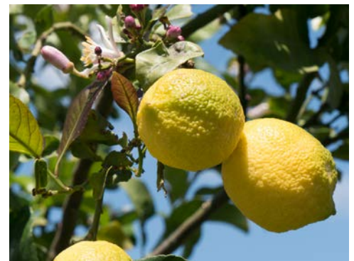
Frische zypriotische Zitronen!