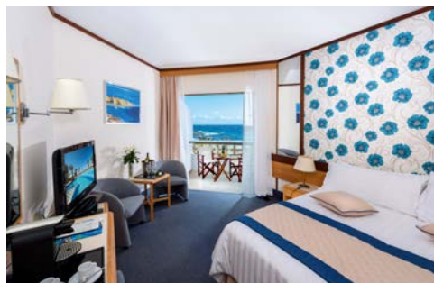
Zimmerbeispiel Standard – Athena Beach Hotel

Das Athena Beach Hotel (Landeskategorie: 4 Sterne) in Paphos besticht durch seine zentrale Lage zu den wichtigsten Sehenswürdigkeiten. Die Anlage verfügt über 3 Süßwasserpools, sowie Innen- und Außen Jacuzzis und ein hauseigener Elixir Spa-Bereich mit Sauna. Entspannen Sie im beheizten Pool oder genießen Sie ein Abendessen in gemütlicher Atmosphäre im hauseigenen Restaurant. Jedes der klimatisierten Gästezimmer verfügt über einen Balkon, Minibar, Haartrockner und Safe