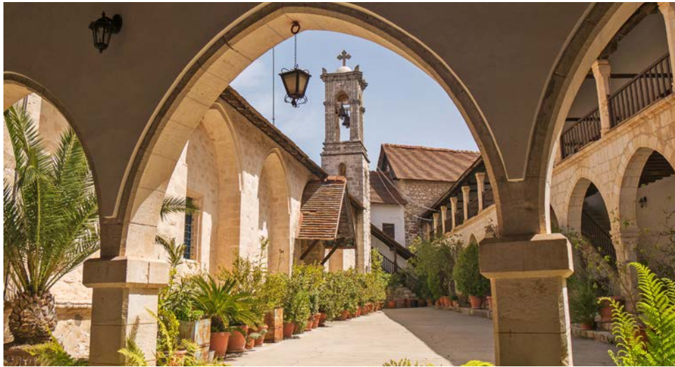
Kloster zum Heiligen Kreuz