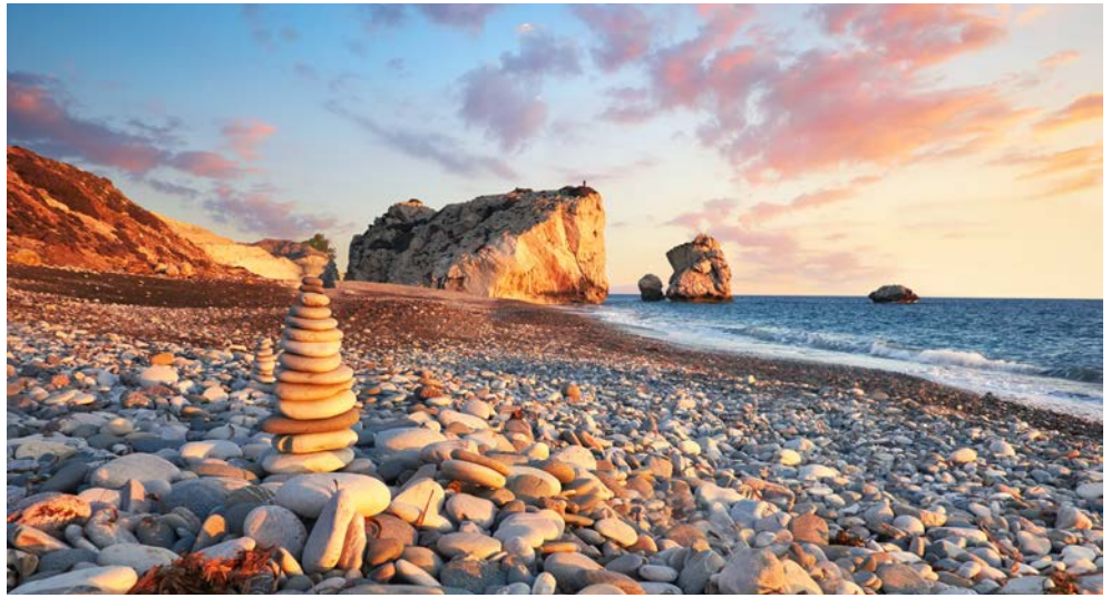
Blick auf den Felsen der Aphrodite

Diese besondere Gartenreise führt Sie auf die drittgrößte Insel des östlichen Mittelmeeres. Die Sonne scheint hier ca. 300 Tage im Jahr – beste Voraussetzungen für die über 1.500 beheimateten Pflanzenarten, darunter Wildorchideen, Affodill und Chrysanthemen. Im Frühling zeigt sich Zypern von seiner grünen Seite – überall summt und brummt es, Kräuter wachsen und Wildblumen blühen. Die Luft ist erfüllt von einem ganz besonderen Duft – denn auch die Kirsch- und Mandelblüte ist voll im Gange und Zitrusfrüchte und diverse Gemüsesorten, darunter die aromatische „rote“ Kartoffel gedeihen prächtig. Selbstverständlich dürfen Sie all die Köstlichkeiten probieren! Sie unternehmen Spaziergänge auf der Akamas Halbinsel und im Troodos Gebirge, lernen Flora und Fauna kennen, wandeln durch Kräutergärten und entdecken die jahrtausendealte Geschichte und Kultur Zyperns. Daneben wird Ihnen auch die jüngere Geschichte der Insel, die seit 1974 in den türkisch besetzten Teil und die Republik Zypern geteilt ist, nähergebracht – ein interessanter geschichtlicher Exkurs. Lassen Sie sich von der herzlichen Gastfreundschaft verzaubern! „Kopiaste“ – was so viel bedeutet wie „Willkommen, sei unser Gast.“