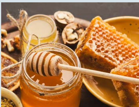
Freuen Sie sich auf eine exklusive Honig-Probe!