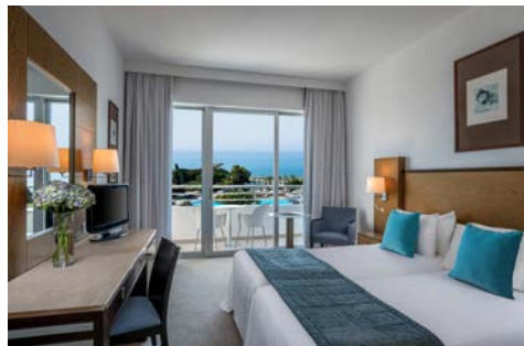
Zimmerbeispiel – Mediterranean

Das am Sandstrand gelegene Hotel Mediterranean Beach (Landeskategorie: 4 Sterne) in Limassol verfügt über 5 Restaurants, welche für ihr kulinarisches Wohlergehen sorgen. Darüber hinaus können Sie vor Ort Freizeitangebote wie Innen- & Außenpool, Fitnesscenter oder Sauna nutzen. Im hoteleigenen „Aquam Helth Spa“ können Sie diverse Behandlungsangebote und Therapien genießen. Alle Zimmer sind klimatisiert und mit TV, Minibar, Safe, Balkon und kostenfreiem WLAN ausgestattet.