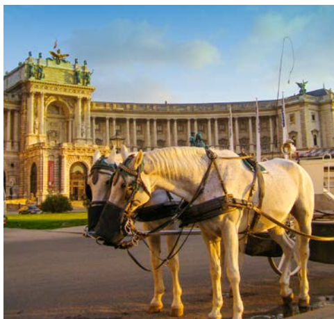
Kurze Verschnaufpause an der Hofburg in Wien

Die Radtour durch das Donauknie ist auch ein Ausflug in die Geschichte Ungarns. Vom ehemaligen Königssitz Visegrad radeln Sie durch die malerische, sanft hügelige Landschaft der Ungarischen Wachau bis nach Esztergom, wo die prachtvolle Basilika hoch über dem Burgviertel in den Himmel ragt. Zwei Fahrradrouten stehen zur Wahl: Die längere Variante beinhaltet einen Abstecher auf die Szentendre-Insel und in die Barockstadt Vác, die kürzere Tour führt direkt nach Esztergom. Nachts Weiterfahrt per Schiff nach Wien. (*60 km-Tour nur für geübte Radfahrer)