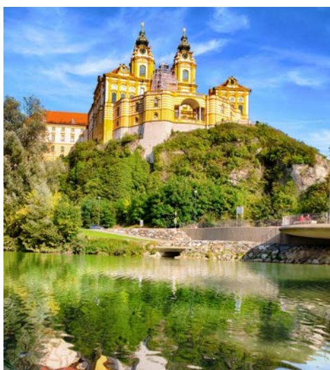
Das Stift Melk

Die sanfte Hügellandschaft, geprägt von verträumten Dörfern, Weinterrassen, Burgen, Klöstern und Ruinen hat noch jedermann verzaubert. Über dem Barockstädtchen Dürnstein thront der blaue