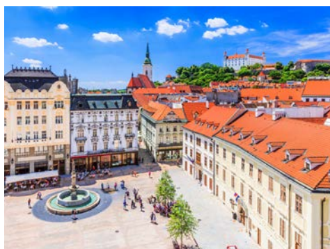
Wunderschön – Bratislava

Sehenswert ist das Stift von Engelhartszell, bekannt für die schön renovierte Kirche, aber auch für die „heilsamen“ Kräuterschnäpse. Hier beginnt die Radtour durch die romantische Flusslandschaft der Donauschlinge, einem der schönsten Donauabschnitte mit verträumten Dörfern am Fuße von saftig-grün bewaldeten Hängen. In Brandstatt gehen Sie wieder an Bord und setzen die Reise per Schiff fort.