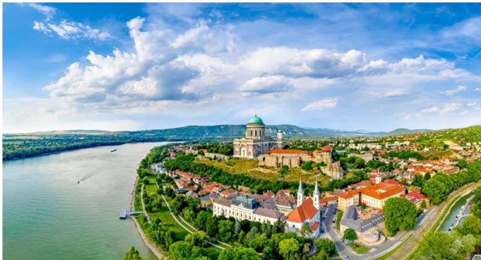
Esztergom am Donauknie