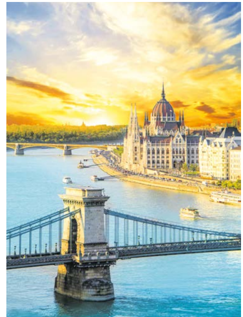
Budapest – Kettenbrücke und Parlament

Ankunft per Schiff in Bratislava gegen Mittag. Entdecken Sie heute die kleine lebendige Hauptstadt der Slowakei. Tipp: Genießen Sie von der Pressburg einen herrlichen Rundblick und fahren Sie mit dem Oldtimerzug durch die zauberhafte Altstadt. Alternativ können Sie die Stadt während einer geführten Radtour erkunden. Nachts Schiffsfahrt von Bratislava nach Budapest.