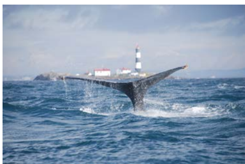
St.-Lorenz-Strom, eines der walreichsten Gewässer

Corner Brook wurde 1767 von Captain James Cook erforscht und ist eine Insel an der Westküste von Neufundland, die den Sankt-Lorenz-Strom vom Atlantischen Ozean trennt. Corner Brook liegt vor der beeindruckenden Kulisse der Long Range Mountains, die den nördlichsten Teil der Appalachen bilden. In dieser Ecke Kanadas steht die Natur im Mittelpunkt. Einige der spektakulärsten Landschaften befinden sich im Gros-Morne-Nationalpark, einem UNESCO-Weltkulturerbe. Das abwechslungsreiche Gelände umfasst Tundra, Wald, Moore, Salzwiesen, Wasserfälle und einen Süßwasserfjord.