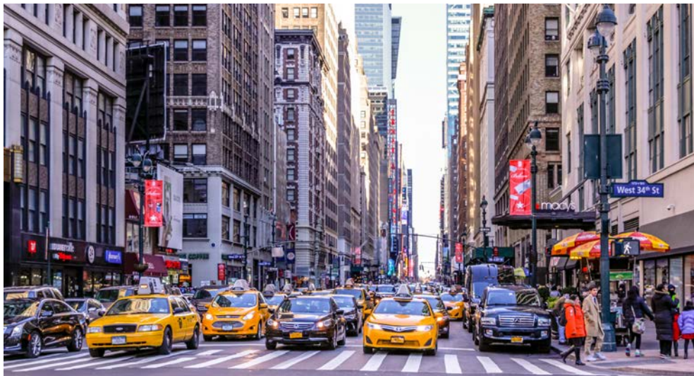
New York erwartet Sie!

prachtvollen Glanz in vollen Zügen. Unter dem funkelnden Kronleuchter spielt im Queens Room das Orchester zum Tanz auf, im Empire Casino erwartet Sie die Glücksgöttin Fortuna und das Royal Court Theatre bittet zu spektakulären Bühnenshows, die eine mitreißende Broadway-Atmosphäre entflammen. Die zahlreichen Bars und Lounges laden zu einem Besuch und zu anregenden Gesprächen mit Ihren Mitreisenden ein – ein wahres Fest für alle Sinne!