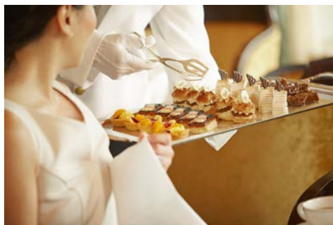
Genießen Sie Ihren Afternoon Tea

Ob Sie Lust auf völlige Entspannung haben oder etwas unternehmen möchten – die kommenden zwei Tage werden Sie immer voll auf Ihre Kosten kommen. Genießen Sie spannendes Entertainment, lassen Sie sich im Spa verwöhnen oder entspannen Sie einfach mit einem Buch in der großen Bibliothek. Nehmen Sie auch auf jeden Fall an dem traditionellen Afternoon Tea teil – täglich zwischen 15.30 Uhr und 16.30 Uhr im Queens Room. Werden Sie Zeuge der Prozession von Kellnern mit weißen Handschuhen, die eine Reihe von Leckereien auf Ihren Tisch bringen. Es umfasst köstliche kleine Sandwiches in unterschiedlichen Varianten, Scones und elegante Patisserie. Natürlich im Reisepreis inbegriffen.