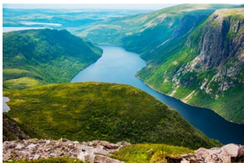
Impressionen im Gros-Morne-Nationalpark

prachtvollen Glanz in vollen Zügen. Unter dem funkelnden Kronleuchter spielt im Queens Room das Orchester zum Tanz auf, im Empire Casino erwartet Sie die Glücksgöttin Fortuna und das Royal Court Theatre bittet zu spektakulären Bühnenshows, die eine mitreißende Broadway-Atmosphäre entflammen. Die zahlreichen Bars und Lounges laden zu einem Besuch und zu anregenden Gesprächen mit Ihren Mitreisenden ein – ein wahres Fest für alle Sinne!