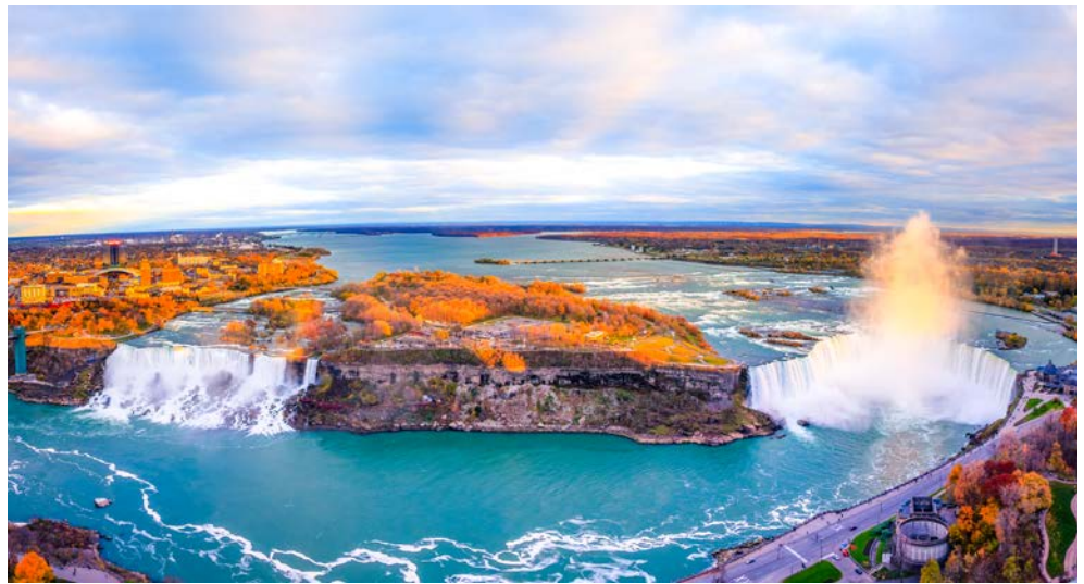
Majestätisch – die Niagarafälle