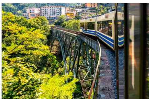
Die Centovalli Bahn

Ihr heutiger Ausflug führt Sie ins Sopraceneri des Schweizer Kantons Tessin. Per Bus geht es nach Domodossola, von wo Sie weiter mit der Centovalli