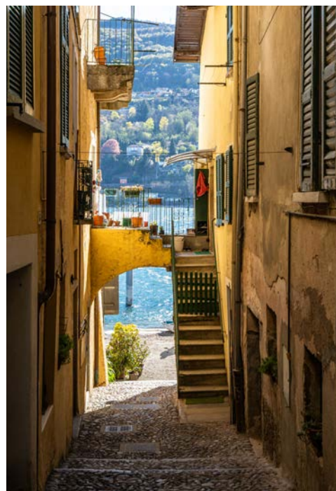
Schmale Gasse in Stresa