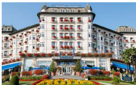
Das Hotel Regina Palace