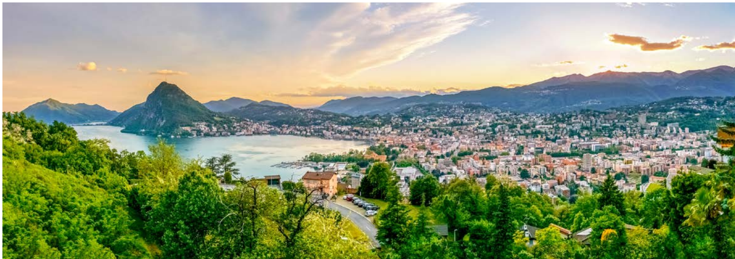
Der Luganer See

schönsten Botanischen Gärten der Laghi und präsentiert sich zu jeder Jahreszeit, auf einer Fläche von 16 ha, von seiner besten Seite. Im Frühjahr bezaubert er mit über 500 verschiedene Rhododendron-Arten und einem Blütenmeer von über 80.000 Tulpen in verschiedenen Farben. Flanieren Sie durch den Park, vorbei an alten Buchen und an einer Fülle von exotischen Pflanzen. Nach einer Mittagspause in Intra kehren Sie nach Stresa zurück, wo Ihnen bis zum gemeinsamen Abendessen die Zeit zur freien Verfügung steht.