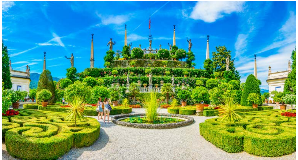
Der Barockgarten auf der Isola Bella

Lassen Sie sich auf dieser Reise von der Schönheit der Natur verzaubern. Verbringen Sie eindrucksvolle Tage am schönsten der Oberitalienischen See, dem Lago Maggiore. Entdecken Sie die zaubernden Borromäischen Inseln vor den Ufern des italienischen Küstenörtchens Stresa gelegen und genießen Sie einen fantastischen Blick auf den Luganer See aus 925 m Höhe. Erleben Sie südländisches Flair bei einem Bummel durch die Gassen von Como am Comer See und fahren Sie durch das Centovalli ins Palmenparadies des Lago Maggiore nach Locarno und Ascona. Bestaunen Sie die zweitgrösste Kirche Italiens, den Mailänder Dom und erfahren Sie beim Flanieren durch die berühmte Galleria Vittorio Emanuele II. das Gefühl des „Dolce far niente“.