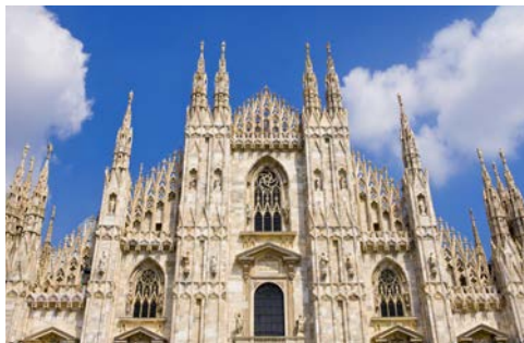
Der Mailänder Dom

Der Tag steht Ihnen für eigene Unternehmungen zur freien Verfügung oder Sie unternehmen einen Ausflug in die norditalienische Stadt Mailand, Metropole der Mode und der Wirtschaft. Auf einer Stadtrundfahrt lernen Sie die Hauptstadt der Lombardei kennen. Sie besichtigen den berühmten, im gotischen Stil erbauten Mailänder Dom, der nach St. Peter in Rom, zum zweitgrößten Kirchenraum Italiens zählt. Ein Spaziergang durch die elegante Einkaufspassage Galleria Vittorio Emanuele II. führt Sie zur weltbekannten Mailänder Scala, wo u.a. der große Opernkomponist Giuseppe Verdi neun seiner Opern uraufführte. Nach einer Führung durch die Mailänder Scala steht Ihnen die Zeit bis zur Rückfahrt nach Stresa für eigene Erkundungen zur freien Verfügung. Bei einem gemeinsamen Abendessen im Hotel lassen Sie den Tag ausklingen.