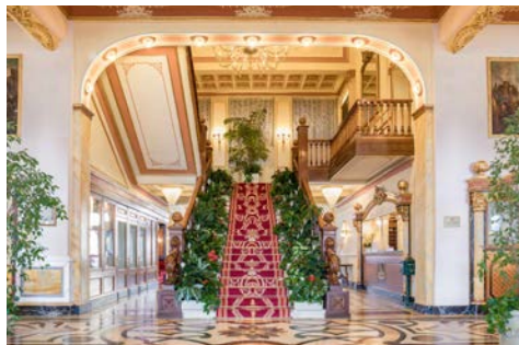
Herzlich willkommen im Hotel Regina Palace in Stresa