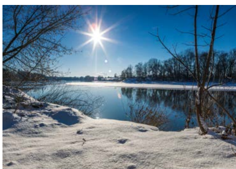
Mit etwas Glück ist es winterlich schön

des Prinzipalkommissars und das des Generalpostmeisters. Für den Verlust wurden sie vom Bayerischen Königreich u. a. mit Waldbesitz und dem ungenutzten Stiftsgebäude des Klosters St. Emmeram entschädigt. Die Familie Thurn und Taxis baute das Kloster zu ihrer Hauptresidenz aus. Heute zählt es zu den größten privaten Schlössern in Europa. Noch heute lebt ein Teil der Familie Thurn und Taxis in Teilen des Schlosses. In der Führung sehen Sie einen Teil des Schlosses mit seinen fürstlichen Prunkräumen, wertvollen Gemälden, wunderschönen Wandteppichen sowie den Kreuzgang und die angrenzenden Gebäude aus dem ältesten Teil des Klosters.