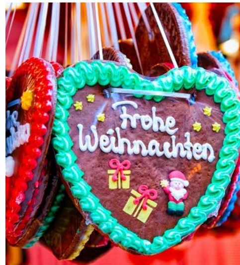
Auf dem Weihnachtsmarkt

des Prinzipalkommissars und das des Generalpostmeisters. Für den Verlust wurden sie vom Bayerischen Königreich u. a. mit Waldbesitz und dem ungenutzten Stiftsgebäude des Klosters St. Emmeram entschädigt. Die Familie Thurn und Taxis baute das Kloster zu ihrer Hauptresidenz aus. Heute zählt es zu den größten privaten Schlössern in Europa. Noch heute lebt ein Teil der Familie Thurn und Taxis in Teilen des Schlosses. In der Führung sehen Sie einen Teil des Schlosses mit seinen fürstlichen Prunkräumen, wertvollen Gemälden, wunderschönen Wandteppichen sowie den Kreuzgang und die angrenzenden Gebäude aus dem ältesten Teil des Klosters.