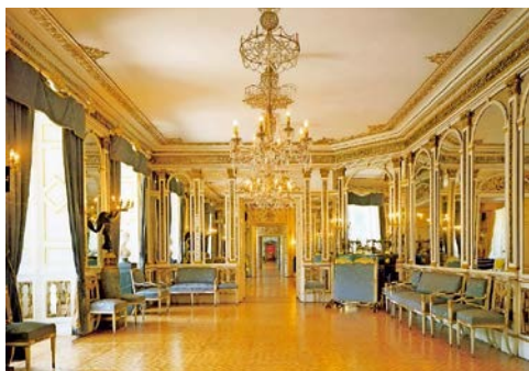
Schloss Thurn und Taxis

Nach Ihrer Führung bleiben Sie am Schloss und lassen sich von der einmaligen Atmosphäre des Weihnachtsmarktes im Schlosshof verzaubern. In allen Häuschen herrscht geschäftiges Treiben: Traditionelle Handwerker – vom Drechsler und Schmied bis hin zum Kerzenzieher, Krippenbauer, Wollefilter, Herrgottschnitzer, Korbflechter, Töpfer, Bürsten- und Besenbinder oder dem berühmten „Hutmacher vom Dom“ – produzieren hier ihre Waren und Unikate und bieten diese vor Ort feil. Überall in den Budenstraßen sorgen offene Feuerstellen für Wärme und Behaglichkeit.