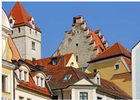
Historische Fassaden in der Altstadt