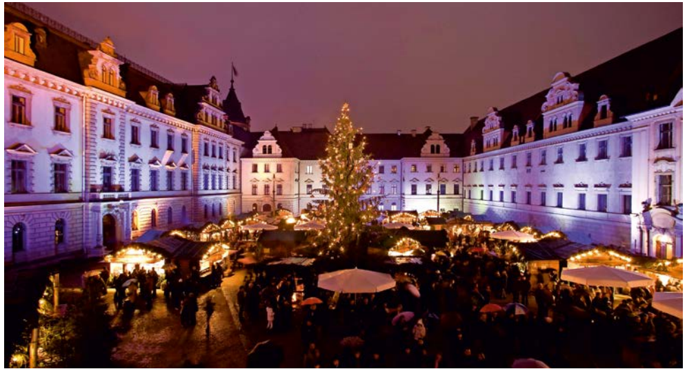
Stimmungsvoll – Weihnachtsmarkt am Schloss Thurn und Taxis

Besuchen Sie Regensburg zur Adventszeit und erleben Sie die vorweihnachtliche Stimmung auf einem der schönsten Weihnachtsmärkte weltweit, welcher sich im Innenhof von Schloss Thurn und Taxis befindet. Die über 2000 Jahre alte Stadt Regensburg wurde von den Römern gegründet und entwickelte sich im Mittelalter zu einer der bedeutendsten Städte Europas. Dank ihrer einstigen politischen Bedeutung und Rolle als mittelalterliches Handelszentrum, als auch der herausragenden architektonischen und städtebaulichen Qualitäten, wurde die „Altstadt Regensburg mit Stadtamhof“ im Jahre 2006 zum UNESCO-Welt-erbe ernannt. In der „nördlichsten Stadt Italiens“, wie Regensburg auch genannt wird, kann man die zahlreichen Werke romanischer und gotischer Baukunst in der historischen Altstadt bewundern. Kaum eine Stadt Deutschlands spiegelt die wichtigen politischen, wirtschaftlichen und religiösen Entwicklungen des hohen Mittelalters in ihrem noch vorhandenen Baubestand so lebendig wider.