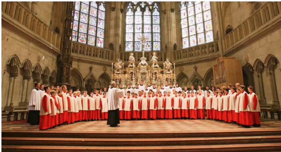
Weltberühmt – der Chor der Regensburger Domspatzen bei einem ihrer begehrten Konzerte