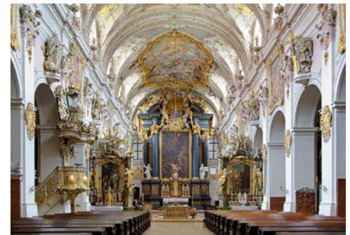
Pracht im Kloster St. Emmeram

Gebäude mit seinem beeindruckenden historischen Reichssaal. Errichtet wurde das Rathaus Mitte des 13. Jahrhunderts, nachdem Regensburg 1245 zur freien Reichsstadt erhoben wurde. Ab 1594 fanden die vom Kaiser einberufenen Reichsversammlungen statt. Im ehemaligen Tanzsaal aus der ersten Hälfte des 14. Jh. tagte von 1663 bis 1806 der „Immerwährende Reichstag.“ Anschließend haben Sie Zeit für eigene Erkundungen. Nutzen Sie die Zeit für einen ausgiebigen Einkaufsbummel und für Ihre Weihnachtseinkäufe in den vielen kleinen inhabergeführten Geschäften und auf den verschiedenen Weihnachtsmärkten in der Innenstadt. Zum Beispiel bietet der älteste Weihnachtsmarkt Regensburgs auf dem Neupfarrplatz mit seiner herrlichen Kulisse vor der einstigen Wallfahrtskirche „Zur Schönen Maria“ einen tollen Blick auf die wunderschöne weihnachtliche Domstadt. Ein weiterer sehr schöner Christkindlmarkt, der Lucrezia Markt, befindet sich auf dem Haidplatz und dem Kohlenmarkt. Genießen Sie die besondere Atmosphäre dieser Stadt, welche man in der Vorweihnachtszeit verspürt.