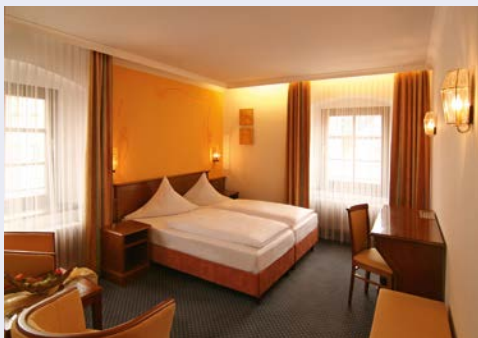
Zimmerbeispiel im Hotel