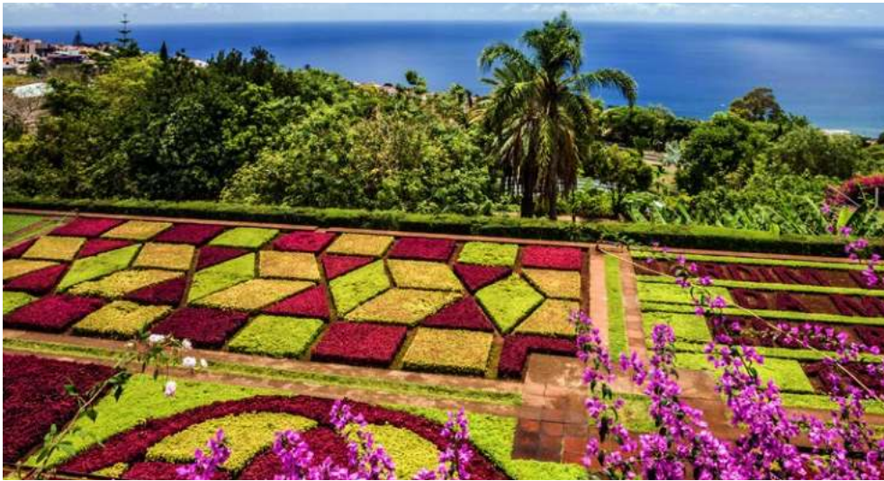
Der Botanische Garten in Funchal, Madeira