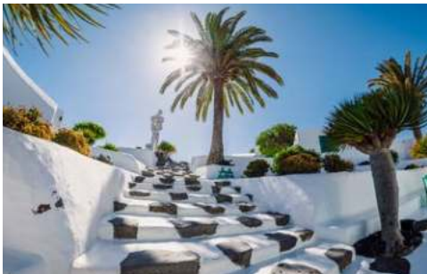
Museo del Campesino auf Lanzarote

Auf Lanzarote beginnt eine neue Welt: Hier eröffnen sich Ihnen unvorstellbar vielfältige Vulkanlandschaften, der Nationalpark Timanfaya mit seinen eindrucksvollen Feuerbergen und die berühmten Werke des Künstlers und Architekten César Manrique. Der Jardin de Cactus z.B., ein riesiger Kakteengarten, der in einen offen gelassenen Steinbruch hinein gebaut wurde, war eine lang gehegte Idee des Künstlers. Bereits im Jahre 1970 entstanden die Pläne des Gartens, doch erst neunzehn Jahre später konnte er ihn endlich im Auftrag der Inselregierung realisieren. Im Norden der Insel hat er in einem einzigartigen, zusammenhängenden Höhlensystem vulkanischen Ursprungs, den Jameos del Agua, ein Zentrum für Kunst und Kultur geschaffen. Kernstück dieser unterirdischen Anlage ist ein Konzertsaal mit etwa 600 Sitzplätzen. Warum machen Sie sich nicht ein Bild von Manriques fantasievollen Kunstwerken, die sich harmonisch in die Natur einfügen?