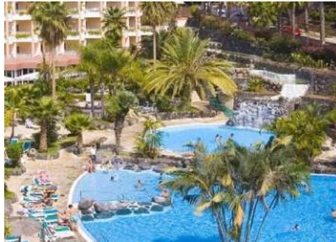
Blick von Ihrem Hotel auf den Pool

Das 4-Sterne Hotel Puerto Palace befindet sich in Puerto de la Cruz im Norden Teneriffas. Von Ihrem Hotel haben Sie einen herrlichem Blick auf das Orotava-Tal, den Teide und den Atlantik. Restaurants, Einkaufs- und Freizeitmöglichkeiten sind in direkter Nähe. Das gemütliche und familiäre Hotel ist seit zwei Generationen unter deutscher Leitung und bietet Ihnen das perfekte Ambiente für Ihren Aufenthalt auf Teneriffa. Die charmant eingerichteten Zimmer verfügen über einen Balkon und einen Minikühlschrank.