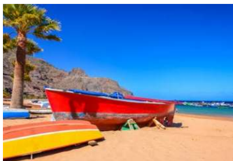
Palmenstrand Las Teresitas