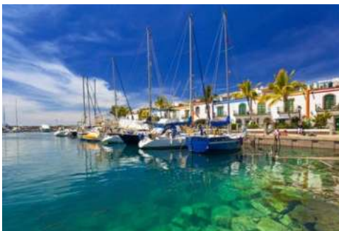
Puerto de Mogan auf Gran Canaria

Von allen Urlaubsfreuden etwas, das bietet Ihnen die kreisrunde und wohl bekannteste Kanareninsel Gran Canaria. Den Westen der Insel kennzeichnen