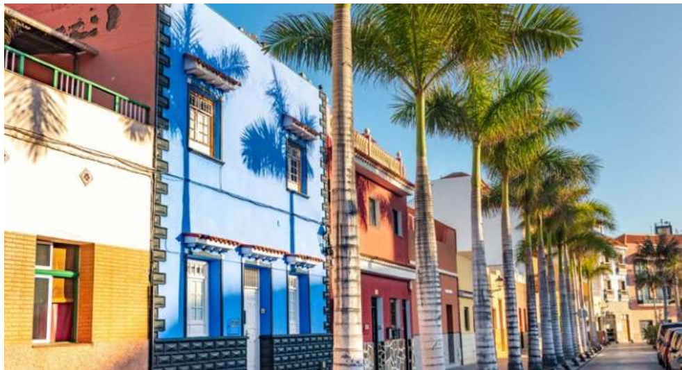
Teneriffa – Puerto de la Cruz

Freuen Sie sich auf eine beeindruckende Reisekombination: Über den Jahreswechsel erleben Sie ein Feuerwerk der guten Laune in Ihrem charmanten 4-Sterne Hotel in Puerto de la Cruz! Als nächstes wartet eine abwechslungsreiche Kreuzfahrt mit unvergesslichen Erlebnissen auf Sie: Die Prunkstücke der Kanaren wollen von Ihnen entdeckt werden. Dabei lacht Ihnen die Sonne zu, das Meer wiegt Sie sanft auf Ihrer Sonnenliege oder in Ihrer komfortablen Kabine in den Schlaf. Es wartet eine paradiesische Natur auf Sie mit wunderschönen Stränden und Buchten, zauberhaften Städten sowie einer einmaligen Vegetation. Langeweile kommt auf AIDAcosma garantiert nicht auf, wenn Sie das abwechslungsreiche Showprogramm im Theatrium und die verschiedenen Sport- und Wellnessangebote wahrnehmen.