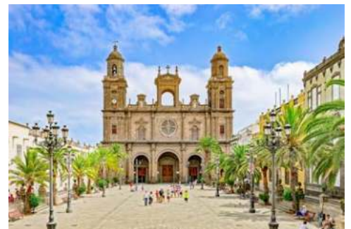
Kathedrale Santa Ana in Las Palmas