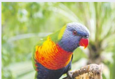
Bunte Papageien auf Teneriffa