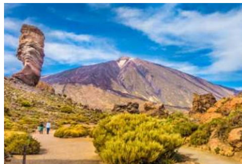
Blick auf den Teide

Rund 900 km vom Mutterland entfernt, befindet sich die portugiesische Insel Madeira mitten im Atlantik. Durch das ganzjährig milde Klima ist Madeira jedem Wachstum gegenüber gnädig. So vollzog sich der Wandel von der Wald- zur Blumeninsel im 18. Jh. ganz von alleine. Europa befand sich im Blütenrausch. Die aufgeklärte Gesellschaft begeisterte sich für alles, was exotisch war. Pflanzensammler wurden ausgesandt, auf dass Fürsten und Könige ihre Gärten mit Gefundenem dekorieren konnten. Madeira lag auf der Route vieler Sammler. Insbesondere die Briten bedienten sich der Insel als Zwischenstation. Bei der Rückkehr brachten sie stets neue Pflanzen mit. Heute können Sie praktisch jede auf Madeira angesiedelte und beheimatete Spezies im Botanischen Garten in Funchal bewundern. Nicht umsonst kommen Jahr für Jahr Tausende Besucher aus einem einzigen Grund auf das portugiesische Eiland: einmal in das Blumenmeer auf der „Insel des ewigen Frühlings“ eintauchen.