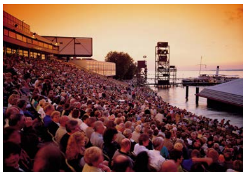
Unvergleichlich – diese Atmosphäre bei den Festspielen

Der heutige Tag steht ganz im Zeichen der Bregenzer Festspiele. Am Vormittag fahren Sie nach Bregenz, wo Sie auf einer Backstage-Führung einen Blick hinter die Kulisse der Bregenzer Festspiele werfen können. Auf einem geführten Stadtpaziergang durch die Altstadtgassen von Bregenz lernen Sie die Vorarlberger Landeshauptstadt kennen. Anschließend Rückfahrt nach Lindau, wo Ihnen der Nachmittag für eigene Unternehmungen zur freien Verfügung steht. Nach einem gemeinsamen Abendessen im Hotel legen Sie mit dem Schiff nach Bregenz ab. Ein Sektempfang verkürzt Ihnen die Fahrt, bevor Sie auf der OpenAir-Bühne der Bregenzer Festspiele Ihren Platz einnehmen. Lassen Sie sich von imposanter Kulisse und magischem Bühnenbild verzaubern, wenn Carl Maria von Webers „Der Freischütz“ auf der Seebühne aufgeführt wird. Per Schiff geht es zurück nach Lindau.