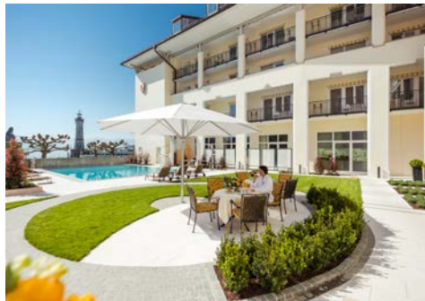
Hotel Bayerischer Hof