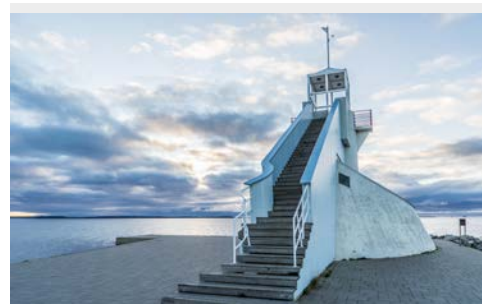
Der Leuchtturm in Oulu