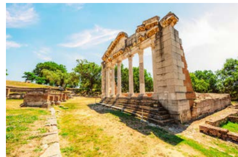
Ausgrabungen von Apollonia

Kolonie unter dem Namen Aulona gegründet. 1912 wurde hier die Unabhängigkeit vom Osmanischen Reich erklärt, und die Stadt Vlora diente als Hauptstadt Albanien. Sie besuchen u.a. den Platz der Unabhängigkeit, die Altstadt, den Ismail Qemal Boulevard, den Isa-Boletini-Platz, sowie das Unabhängigkeitsmuseum (von außen). Fahrt nach Saranda und Bezug Ihres Hotels. Abendessen und Übernachtung.