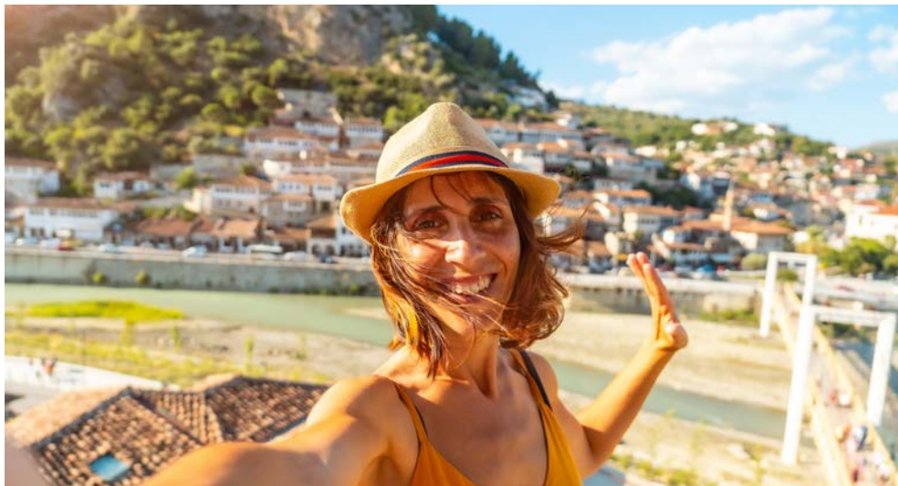
„Stadt der tausend Fenster“ Berat