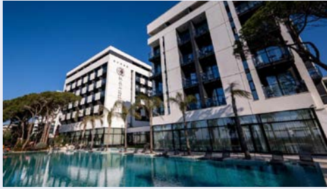
Ihr Hotel Max Royal G