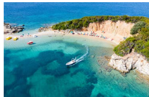
Ksamil, die „Karibik Albanien“