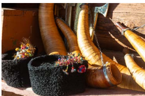
Auf den Märkten gibt es viel Kunsthandwerk

Durres besichtigen Sie Gjirokaster. Die faszinierende Altstadt von Gjirokaster gehört zum UNESCO Weltkulturerbe. Sie besuchen zuerst die Burg mit Blick auf die gesamte Stadt und ihre Umgebung. Von dort werden Sie auf einem kleinen Spaziergang die schmalen Gassen der Stadt erkunden. Anschließend haben Sie Freizeit für eigene Unternehmungen. Weiterfahrt nach Durres. Abendessen und Übernachtung im Hotel.