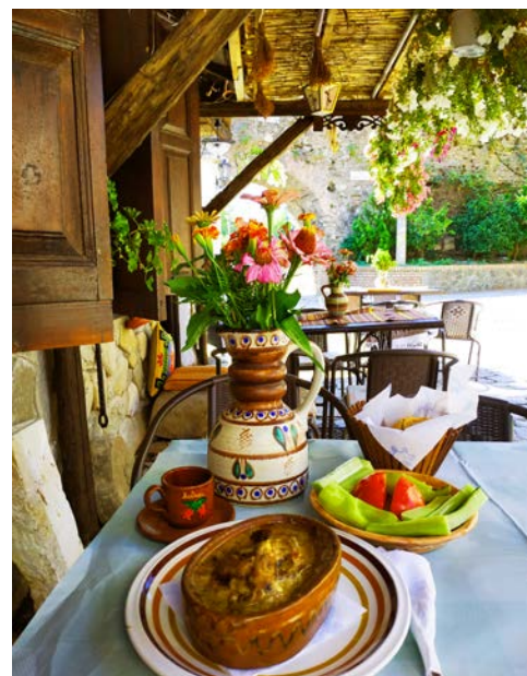
Die albanische Küche