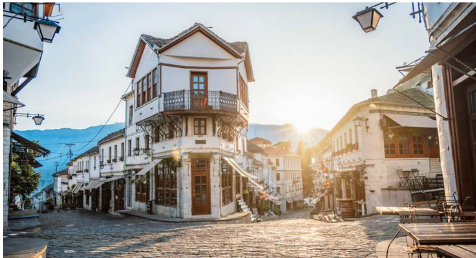
Gassen in Gjirokastra