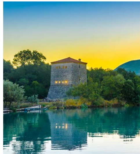
Der venezianische Turm in Butrint