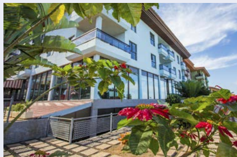
Das Hotel AluaSoul Orotava Valley

Flug-, Hotel- & Programmänderungen vorbehalten. An- und Abreisetag dienen ausschließlich der Erbringung der vertraglichen Beförderungsleistungen. Je nach Fluggesellschaft und Flugdauer werden Bordverpflegung und Getränke nur gegen Bezahlung angeboten. Stand 12/24 – alle Angaben ohne Gewähr.