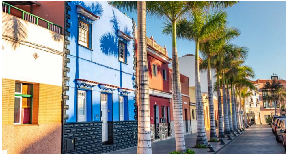
Malerische Gassen in Puerto de la Cruz

Wer sich Anfang März nach Sonne sehnt und trotzdem in Europa bei angenehmen Temperaturen Urlaub machen möchte, ist auf Teneriffa genau richtig! Die größte der Kanareninseln erwartet Sie mit mildem Klima und mit facettenreicher landschaftlicher Vielfalt. Mächtig erhebt sich der Pico del Teide, der höchste Gipfel Spaniens, mit 3.718 m über der Insel. Die Blütenpracht in botanischen Gärten, das Grüne des Anaga-Gebirges und die durch Lava entstandenen Naturpools und Strände werden Sie begeistern. Erkunden Sie im Rahmen des zusätzlich buchbaren Ausflugspakets die malerischen Gassen in Garachico, probieren Sie von den Köstlichkeiten der Insel, u.a. den Mojo-Kartoffeln und genießen Sie die herrliche und einmalige Landschaft im Teide Nationalpark. Diese Reise könnte nicht abwechslungsreicher sein.