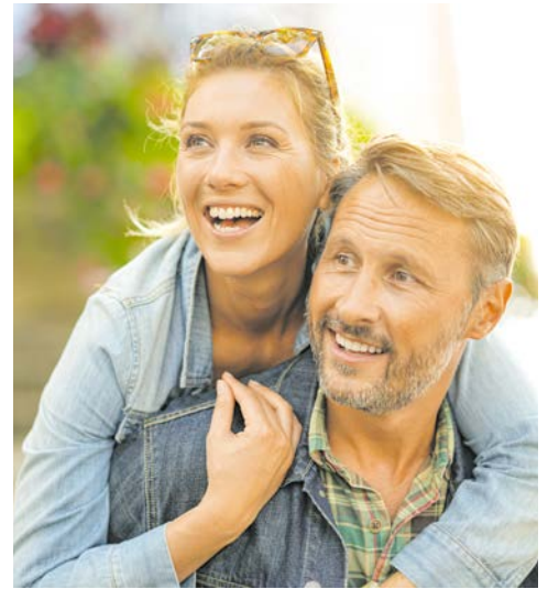
Genießen Sie Ihre Reise