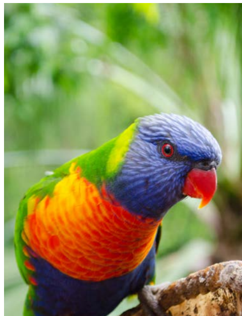
Mit etwas Glück sehen Sie bunte Papageien

Hasta luego! Heute ist Ihr wunderschöner Urlaub leider schon zu Ende und es erfolgen der Transfer zum Flughafen und der Rückflug nach Hause.