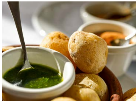
Ein köstlicher Klassiker – Kartoffeln mit „mojo verde“

Der heutige Ausflug beginnt mit dem Besuch des Orchideengarten „Sitio Litre“, wo Sie zauberhafte Orchideen zu sehen bekommen. Seit 1774 ist er in englischem Privatbesitz und somit der älteste Garten auf Teneriffa. Danach fahren Sie zu der alten Universitätsstadt La Laguna, wo Sie die Markthalle besuchen werden. Danach geht es in die Altstadt, welche von der UNESCO zum Weltkulturerbe ernannt wurde. In den Straßen und Gassen von La Laguna entdecken Sie bei einem anschließenden Rundgang zahlreiche historische Gebäude und Baudenkmäler, deren Architektur von historischer Bedeutung ist. Prachtvolle Paläste und Sakralbauten beherrschen das historische Zentrum. Sie fahren weiter in den dichten Mercedeswald. Durch die häufig aufsteigenden Nebel und die Ursprünglichkeit der Natur umgibt den Mercedeswald eine sehr geheimnisvolle Aura. Er wird auch gerne als Märchenwald bezeichnet. Am Aussichtspunkt „Cruz del Carmen“ werden Sie das Anagagebirge bei einem kleinen Spaziergang hautnah erleben. Auf Ihrer Weiterfahrt fahren Sie durch das fruchtbare Valle Guerra und passieren eines der wichtigsten Agrargebiete der Insel. Hier finden Sie