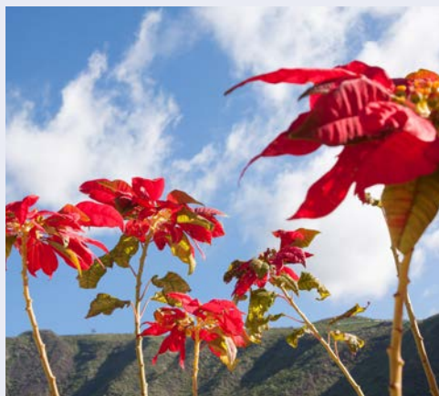
Eine große Pflanzenvielfalt erwartet Sie

Heute fahren Sie zunächst nach Candelaria, der wohl bedeutendste katholische Wallfahrtsort der kanarischen Inseln. Dort befindet sich die berühmte Basilika der Nuestra Señora de la Candelaria. In der Basilika wird die Figur der Schutzheiligen der Kanaren aufbewahrt. Aufgrund ihres dunklen Gesichtes wird sie auch schwarze Madonna genannt. Danach geht es nach Güimar. Dort befindet sich der ethnographische Park "Pirámides de Güimar", welcher 1998 von dem angesehenen norwegischen Forscher Thor Heyerdahl gegründet wurde. Der Park hat ein