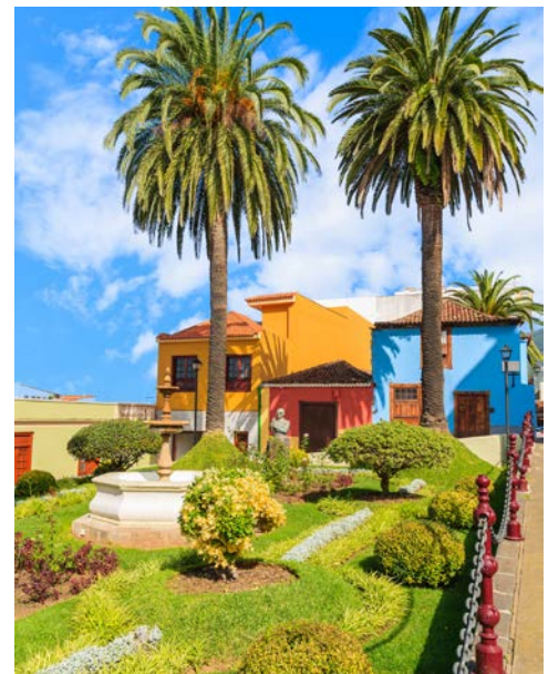
Impressionen in La Orotava

der Insel, daher können Sie den Stadtrundgang in dieser idyllischen Atmosphäre genießen. Vielleicht einen Kaffee gefällig? Das trifft sich gut, denn am Mirador von Garachico wartet noch eine besondere Kaffeespezialität der Kanaren auf Sie: der Barraquito. Die Schichtung aus Espresso, Likör, aufgeschäumter Milch und einer Limette ist nicht nur geschmacklich köstlich, sondern auch eine Augenweide. Nach der Kaffeepause geht es zurück zum Hotel.