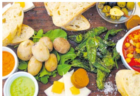
Ein leckeres Tapas-Mittagessen wartet auf Sie

Einer der interessantesten Ausflüge Teneriffas steht auf dem Programm. Über das weitläufige Orotavatal führt Sie die Fahrt in Richtung Cañadas del Teide und bietet Ihnen herrliche Ausblicke auf das Tal. Auf rund 2100 m Höhe erreichen Sie den Nationalpark mit dem Wahrzeichen Teneriffas und höchster Berg Spaniens – der Vulkan Teide. In den Lorbeerwäldern am Außenrand des Kraters herrscht oft Nebel, während im wüstenähnlichen Innern fast immer die Sonne scheint. Sie halten an verschiedenen Aussichtspunkten und an den bekannten Felsformationen Roques de García haben Sie Zeit für einen Rundgang um die auf bizarre, vom Wind zu eigenartigen Formen geschliffenen Lavafelsen aus der Nähe zu betrachten. Auch wird Ihnen am Rande des Nationalparks ein Tapas-Mittagessen mit Wein serviert. Wenn