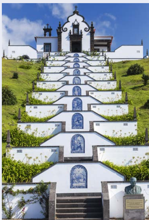
Kirche Nossa Senhora da Paz