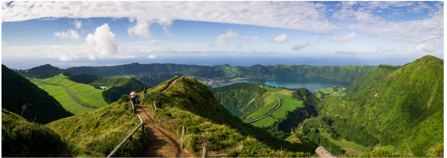
Atemberaubendes Sete Cidades