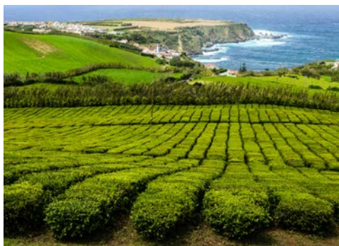
Teeplantage auf São Miguel