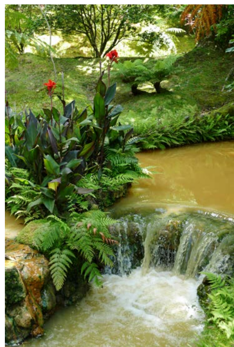
Terra Nostra Park

Fahrt zum Flughafen Ponta Delgada und Rückflug nach Deutschland.