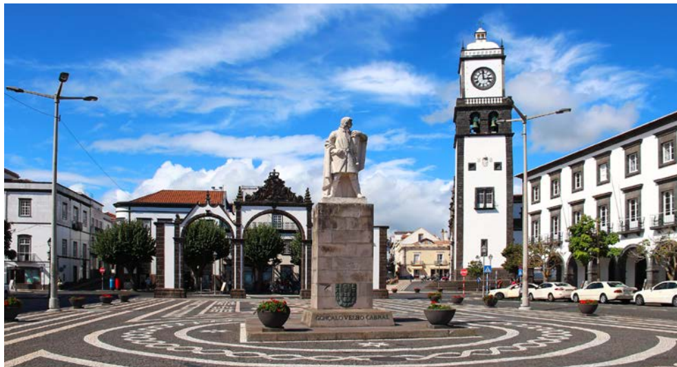
Stadttore in Ponta Delgada

Facettenreiche Vegetation, faszinierende Kraterseen und eine beeindruckende Tierwelt: Der zu Portugal gehörende Archipel der Azoren ist in jeder Hinsicht einzigartig. Über 1.000 Kilometer vom Kernland entfernt hat sich hier mitten im Atlantik eine einzigartige Flora und Fauna herausgebildet. Besonders auf der Hauptinsel São Miguel, die Sie auf dieser Reise während spannender Ausflüge und Erkundungstouren eingehend entdecken werden, finden sich zahlreiche Naturphänomene. Allen voran die atemberaubende Sete Cidades, die in einem Vulkankrater entstanden und von zwei reizvollen Seen geprägt sind. Auch die Lagoa do Fogo befindet sich im Inneren eines alten Kraters. Überhaupt sind die Azoren vulkanischen Ursprungs. Das macht sich auch in der Region rund um den Ort Furnas bemerkbar. Hier befinden sich verschiedene Thermalquellen und Stellen, an denen Wasserdampf und Gase entweichen. Auch der Terra-Nostra-Park, ein botanischer Garten, mit seinen uralten Bäumen, seltenen Pflanzen und seinem warmen Thermalbad ist in dieser Gegend beheimatet. Die artenreiche Flora ist typisch für die Azoren, bedingt durch das hier vorherrschende feuchte, ozeanisch-subtropische Klima. Dank der Lage im Atlantik gibt es keine Extremtemperaturen, die Winter sind mild und die Sommer angenehm warm. Auf die daher üppig grün bewachsene Landschaft São Miguelens bieten sich von zahlreichen Aussichtspunkten immer wieder fantastische Ausblicke.