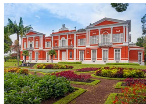
Regierungspalast in Ponta Delgada

Im westlichen Teil der Insel treffen Sie auf die Vulkanseen Sete Cidades. Diese sind mit das Schönste, was die Azoren zu bieten haben. Die Seen liegen auf 250 Meter Höhe und zeigen sich in den Farben blau und grün. Eigentlich ist es nur ein See, der in der Mitte durch eine Bogenbrücke überspannt wird. Um den Ort Sete Cidades ranken sich unzählige Legenden, denen Sie vor Ort genauer nachgehen werden. Der Blick vom Aussichtspunkt Vista do Rei auf das Rund der Caldeira ist wirklich einzigartig. Auf der Rückfahrt nach Ponta Delgada werden Ihnen auf einer Ananas-Plantage die verschiedenen Entwicklungsstadien dieser exotischen Frucht aufgezeigt.