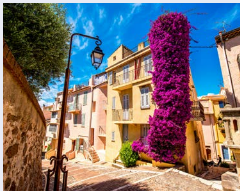
Kleine Gasse in der Altstadt von Cannes