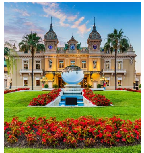
Das berühmte Spielcasino in Monte Carlo