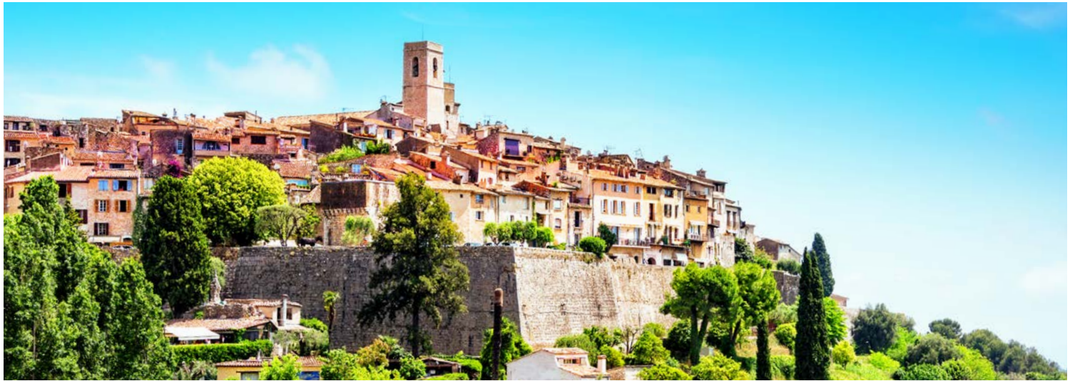
Saint Paul de Vence