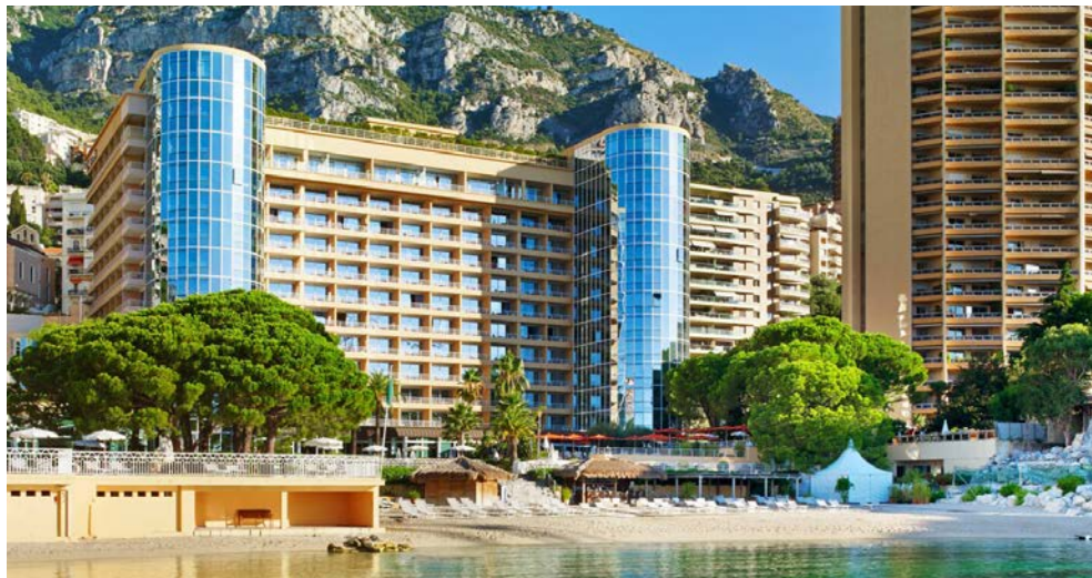
Le Méridien Beach Plaza

Alle Zimmer sind Nichtraucherzimmer, modern und mit allen Annehmlichkeiten ausgestattet. Die Zimmer der Kategorie „Classic“ sind ca. 22-26 m 2 groß und bieten große Panoramafenster, die sich öffnen lassen und auf einen privaten venezianischen Balkon mit Blick auf Monte Carlo führen. Daneben finden Gäste einen Schreibtisch, ein King-Size- oder Doppelbett sowie einen Flachbildfernseher vor. Kabelloser High-Speed Internetanschluss ist gegen Gebühr verfügbar. Jedes Zimmer bietet zudem ein schnurloses Telefon, einen Radiowecker, ein separates Badezimmer mit Badewanne und Dusche, ein reichhaltiges Angebot an Pflegeprodukten, einen professionellen Haartrockner sowie einen Bademantel und Hausschuhe. Zu den weiteren