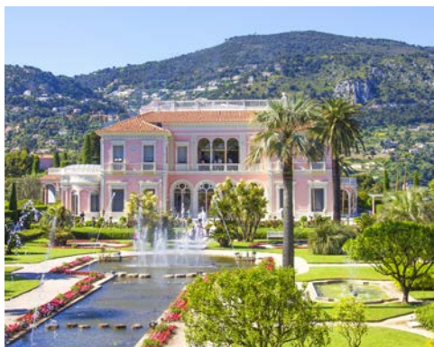
Die Villa Rothschild