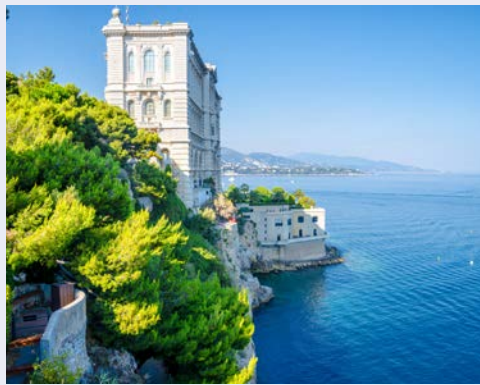
Das Ozeanographische Museum in Monte Carlo

Sie übernachten im 4-Sterne Hotel Le Méridien im Fürstentum Monaco mit dem einzigen Privatstrand in ganz Monte Carlo! Hier genießen Sie die letzten Stunden des Jahres auf monegasische Art bei einem Silvesterdinner, bevor Sie auf ein glückliches und gesundes Jahr 2025 anstoßen.