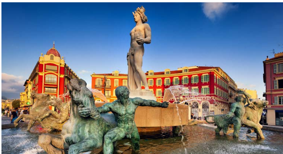
Nizza – Brunnen am Place Massena