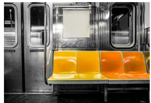
New Yorker Subway

Am Vormittag verdient das MoMA Ihre ganze Aufmerksamkeit. Bei einer Sonderführung werden Highlights einer der interessantesten Kunstsammlungen weltweit gezeigt. Werke weltberühmter Künstler wie Claude Monet, Pablo Picasso und Jackson Pollock sind im MoMA ausgestellt. Im Anschluss an die Führung bleibt selbstverständlich noch genügend Zeit, um die gewonnenen Eindrücke individuell zu vertiefen.