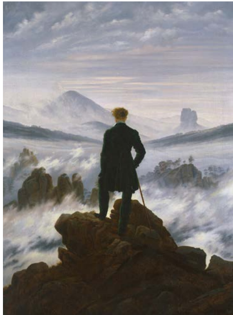
Caspar David Friedrich, Wanderer über dem Nebelmeer, um 1817, Hamburger Kunsthalle, Dauerleihgabe der Stiftung Hamburger Kunstsammlungen

Nach der Landung am frühen Nachmittag in New York erleben Sie bereits während der Fahrt zum Hotel erste Eindrücke dieser schillernden Stadt. Nach dem Hotel-Check-in und Zimmerbezug unternehmen Sie am frühen Abend einen ersten Erkundungsspaziergang durch die glitzernden Straßenschluchten Manhattans. Beeindruckend ist der Times Square, der vor allem abends von überdimensionalen Bildschirmen mit grellen Werbebotschaften illuminiert ist. Tauchen Sie ein, in das Herz vom „Big Apple“!