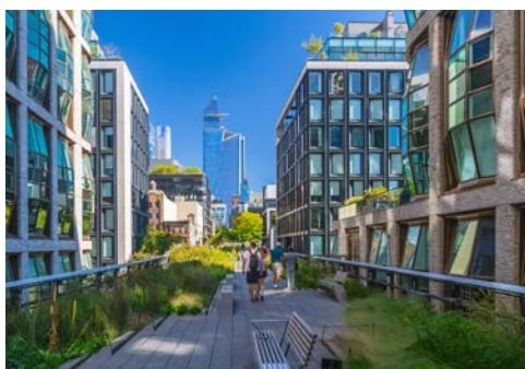
High Line – von Meatpacking District bis Hudson Yards