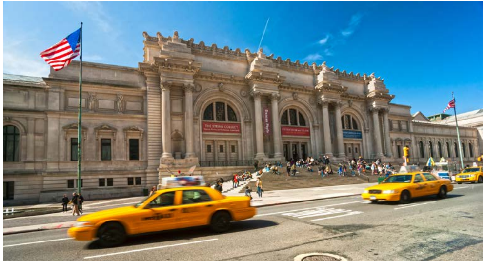
Metropolitan Museum of Art