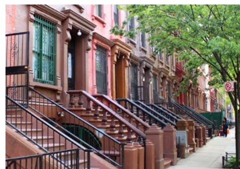
Stadhäuser in Chelsea – die sogenannten Brownstones