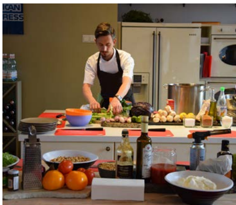
Kochkurs „Moderne lettische Küche“

Am Vormittag erwartet Sie ein besonderes Erlebnis. Gemeinsam mit einem der bekanntesten Köche Lettlands besuchen Sie die faszinierenden Zeppelinhallen in Riga. Diese riesigen, historischen Hangars beherbergen heute einen der größten Märkte der Stadt. Während Sie über den Markt schlendern, haben Sie die Gelegenheit, landestypische Köstlichkeiten zu probieren. Anschließend nehmen Sie an einem einzigartigen Kochkurs zur modernen lettischen Küche teil, bei dem Ihnen die Geheimnisse und Raffineszen der lokalen Gastronomie nähergebracht werden. Nach getaner Arbeit lassen Sie den Nachmittag bei einem genussvollen gemeinsamen Mittagessen ausklingen und können die kulinarischen Höhepunkte des Tages Revue passieren lassen. Der Abend steht Ihnen zur freien Verfügung.