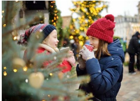
Herzlich Willkommen in Riga