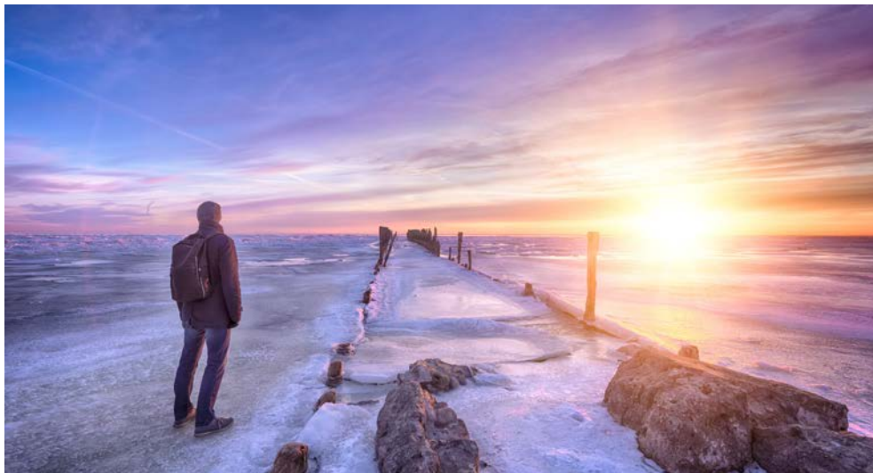
Der Strand von Jurmala