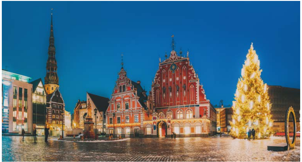
Spaziergang durch Riga

Darüber hinaus unternehmen Sie eine Fahrt an die wunderschöne Ostseeküste. Am herrlichen Strand Jurmala's und entlang der von hölzernen Villen gesäumten Promenade gehen Sie spazieren. Eine gemütliche Mittagspause in einem lokelem Restaurant rundet Ihr Programm geknabert ab.