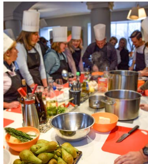
Kochkurs „Moderne lettische Küche“