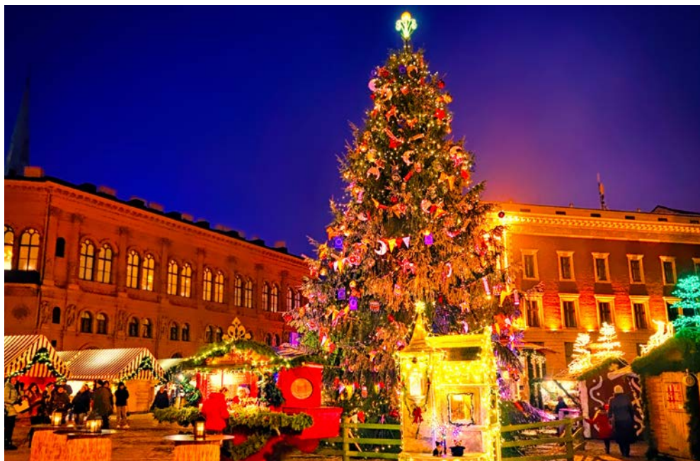
Weihnachtsmarkt am Domplatz

Am Abend erwartet Sie ein Besuch in der Nationaloper von Riga, wo Sie das wunderbare Ballett „Der Nussknacker“ von Pjotr Tschaikowski (Reise am 03.12.) oder die Oper „AIDA“ von Giuseppe Verdi (Reise am 10.12.) genießen.