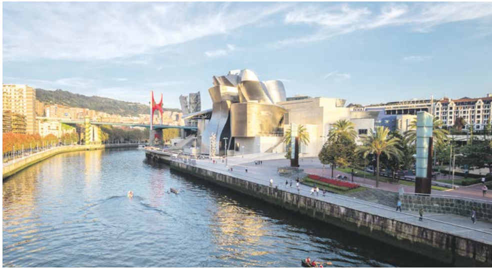
Das berühmte Guggenheim Museum in Bilbao

Hotel zum berühmten Guggenheim-Museum. Das von Frank O'Gehry entworfene Gebäude aus Stahl, Glas, Kalkstein und Titan hat der einstigen Industriestadt am Atlantik ein völlig neues Image gegeben. Direkt am Fluss in der neuen Gegend von Abandoibarra beherbergt das 1997 eröffnete Guggenheim-Museum auf 24.000 m 2 je nach Jahreszeit verschiedene und interessante Wanderausstellungen zeitgenössischer, moderner aber auch klassischer Kunst. Hier können Sie z. B. die Werke von Kandinsky, Marc Chagall, Henri Matisse, Paul Klee, Salvador Dalí, Joan Miró und Juan Gris, Mark Rothko, Anselm Kiefer etc. bewundern. Außerdem sind die permanente Ausstellung mit Skulpturen/Kunstwerken von Richard Serra „The Matter of Time“ sowie die Skulpturen von Jeff Koons und Louise Bourgeois zu sehen. Die Tour endet nach ca. 4 Stunden. Der Nachmittag steht Ihnen zur freien Verfügung.