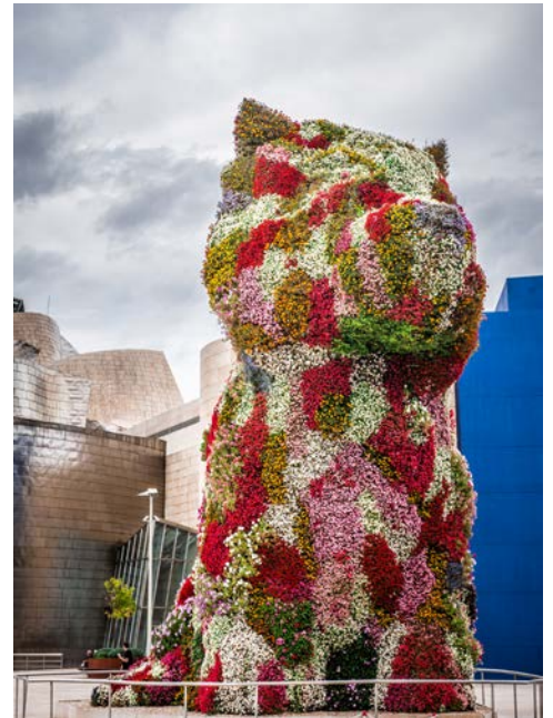
Blumen-Skulptur „Puppy“ vor dem Guggenheim Museum