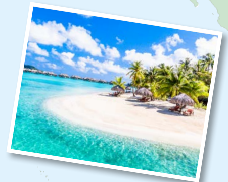
Honolulu Oahu Hawaii