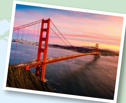
San Francisco USA