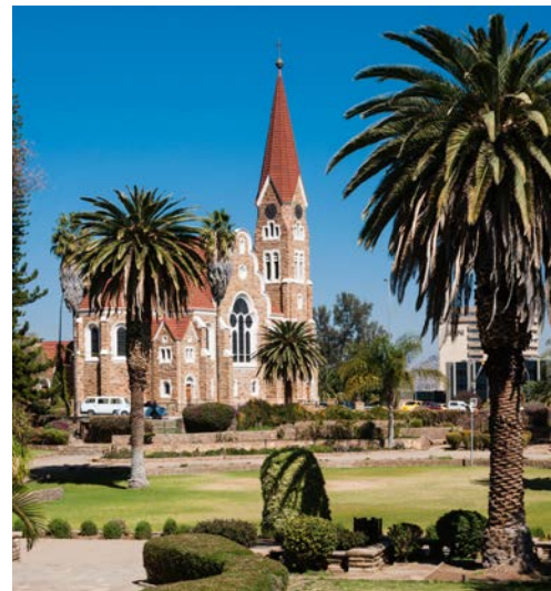
Auf den Spuren deutscher Kolonialgeschichte in Windhoek