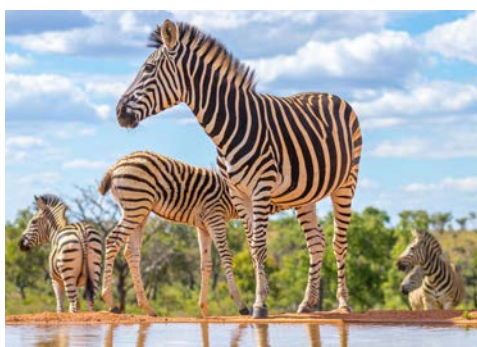
Mit etwas Glück sehen Sie Antilopen, Zebras und Giraffen

Sie fahren heute in eines der größten und schönsten Wildreservate der Welt, in den Etosha-Nationalpark. Charakteristisch sind Buschland und weite, offene Flächen, auf denen Herden von Wildtieren zu sehen sind. Aus nächster Nähe können Sie u. a. Antilopen, Zebras, Giraffen und Elefanten beobachten. Am späten Nachmittag verlassen Sie den Park und fahren zurück zu Ihrer Lodge am Rande des Parks. Abendessen in Ihrer Lodge.