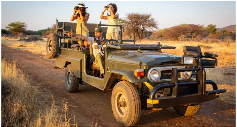
Fantastische Impressionen erwarten Sie

Namibia, das Land zwischen rauer Atlantikküste und der großen Kalahari Wüste, bietet dem Besucher unendlich viele Naturschönheiten: Die Schatten- und Lichtspiele in den riesigen Dünen der Namib Wüste beim Sossusvlei, den Etosha-Nationalpark oder das szenenreiche Erongo-Gebirge sind nur einige Beispiele. Auf Spuren der deutschen Kolonialgeschichte stoßen Sie gleich bei Ankunft in der Hauptstadt Windhoek. Am besten bewahrt scheint das deutsche Erbe in Swakopmund, der Stadt am Atlantik. Die ganze Vielfalt der Tierwelt im südlichen Afrika lernen Sie auf einer Pirschfahrt im Etosha-Nationalpark kennen.