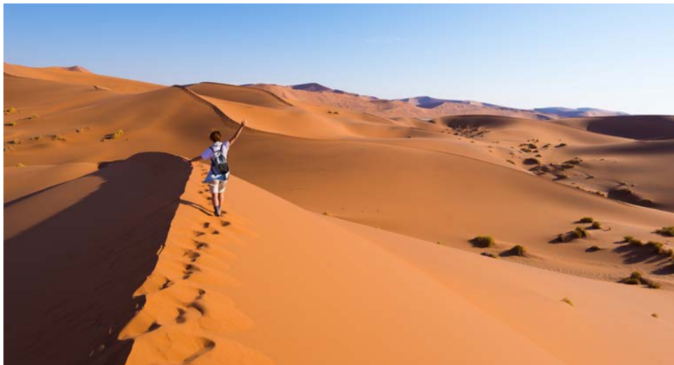
Dünen des Sossusvlei in der Namib-Wüste