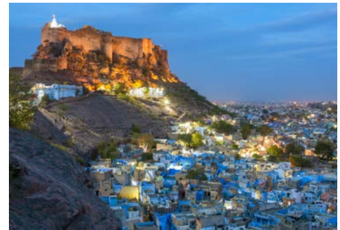
Die „Blaue Stadt“ und Fort Mehrangarh

Die Tagesetappe führt nach Jodhpur am Rande der Wüste Tharr im Nordwesten Rajasthans. Die Verwendung von überwiegend blauer Wand- und Fassadenfarbe hat der Stadt den Beinamen „Blaue Stadt“ eingetragen. Über der ausgedehnten Altstadt thront auf einem hohen Felsen das mächtige Fort Mehrangarh. Danach besuchen Sie Jaswant Thada, einer dem Maharadscha Jaswant Singh II gewidmeten Gedenkstätte. Übernachtung in Jodhpur.