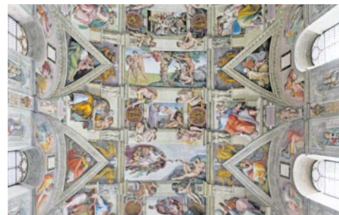
In der sixtinischen Kapelle

Heute Vormittag besteht die Gelegenheit an der wöchentlichen Papstaudienz mit Papst Franziskus teilzunehmen. Vom Wetter abhängig findet die Audienz bei gutem Wetter auf dem Peterplatz oder bei Regen in der von Luigi Nervi gebauten Audienzhalle statt. Im Anschluss Transfer zum Flughafen und Rückflug.