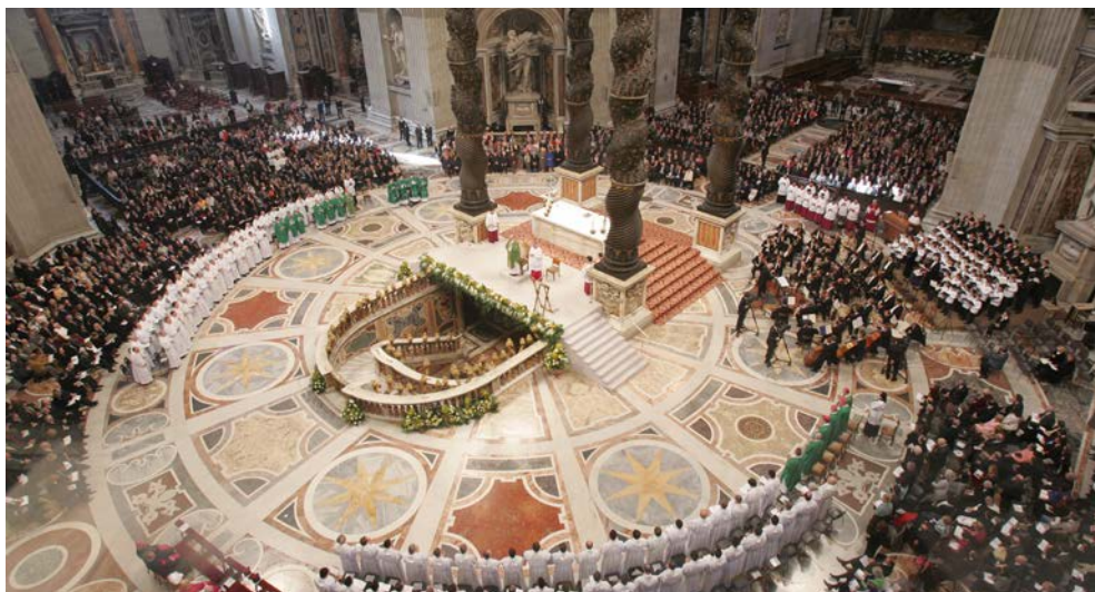
Freuen Sie sich auf fantastische Konzerterlebnisse

Besichtigung der heute unterirdisch gelegenen Domus Aurea, einst von Kaiser Nero als Kaiserpalast entworfen. Im Anschluss erleben Sie den Alltag der antiken Römer bei einer ausführlichen Führung durch das Forum Romanum, dem legendären Mittelpunkt des römischen Weltreichs. Hier spielte sich das religiöse, politische und wirtschaftliche Leben ab. Besichtigen Sie das berühmteste aller Amphitheater, das Kolosseum 80 n. Chr. errichtet, das durch seine monumentalen Ausmaße beeindruckt. Gemeinsames Abendessen und anschließendes Konzert in der Kirche des Heiligen Ignatius von Loyola am Campo Marzio aus Anlass des 200. Geburtstages von Anton Bruckner mit den St. Florianer Sängerknaben aus Österreich.