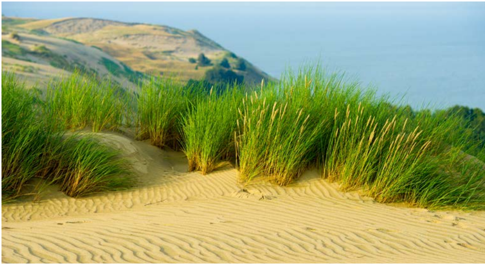
Impressionen der Kurischen Nehrung