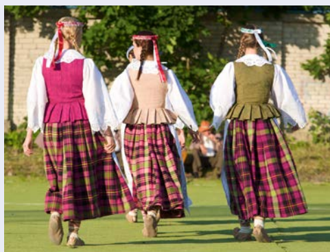
Willkommen in Litauen