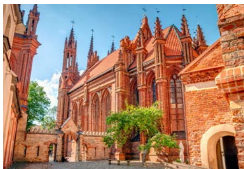
Gotik pur – die St. Annen Kirche in Vilnius

Heute endet Ihre Rundreise mit dem Transfer zum Flughafen und Rückflug nach Deutschland.