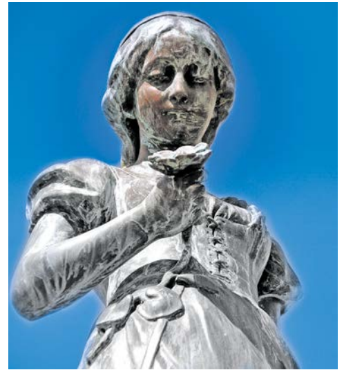
„Ännchen von Tharau“ in Klaipeda