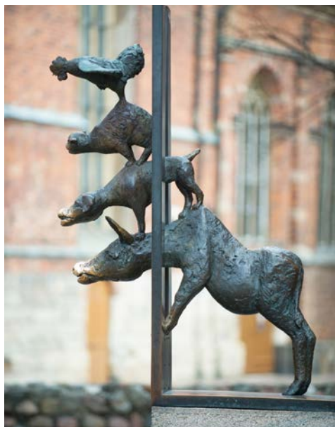
Die Stadtmusikanten von Riga