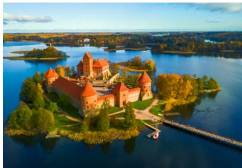
Die Wasserburg von Trakai