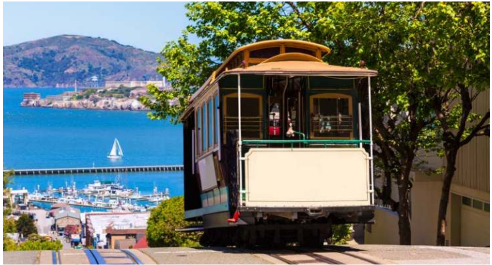
San Francisco - unternehmen Sie eine Fahrt mit der berühmten CableCar!

Wenn Träume reisen ... Dann sind sie wohl bei uns angekommen! Wer etwas ganz Besonderes erleben möchte, wer schon immer davon geträumt hat, unsere riesige und so fantastische Welt zu erkunden, der ist auf dieser exklusiven Sonderreise genau richtig. „Round the World“ mit der unglaublich vielfältigen OVATION OF THE SEAS ist die Erfüllung eines Lebenstraums. Die Stadt der Golden Gate Bridge, San Francisco, ist wunderschöner Auftakt Ihrer Reise – Komforthotel, Stadtrundfahrt ... saugen Sie diese ganz besondere Atmosphäre in sich auf. Ein lebensfrohes und buntes „Aloha“ begegnet Ihnen dann in Honolulu – Hawaii, der Inbegriff paradiesischer Träume, wartet auf Sie. Damit nicht genug, heißt es dann „Willkommen an Bord eines der innovativsten Schiffe der Welt“. Die OVATION OF THE SEAS ist so viel mehr als ein Schiff. Mit ihr gleiten Sie durch den Südpazifik zu den Perlen Französisch-Polynesien, über Neuseeland bis nach Australien. Sydney empfängt Sie zu einem krönenden Nachprogramm – natürlich inklusive Privatführung im berühmten Opernhaus!