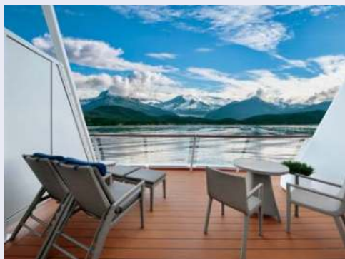
Herrliche Aussicht vom Balkon aus (Beispiel)

Willkommen an Bord eines der innovativsten Schiffe der Welt, mit einem einzigartig spannenden Unterhaltungsangebot sowie noch nie da gewesenen kulinarischen Attraktionen. Die OVATION OF THE SEAS® verbindet Mensch und Technik auf einzigartige Weise. Der Gast steht im Vordergrund, ob durch die hervorragend geschulte, serviceorientierte Crew oder beim Cocktailmixen durch einen Roboter in der Bionic Bar® (Getränke kostenpflichtig). Genießen Sie z.B. mediterrane Köstlichkeiten von Jamie Oliver im Jamie's Italiano (gegen Gebühr) oder einen exotischen Drink in der North Star Bar (Getränke kostenpflichtig), bevor Sie das technische Wunderwerk North Star® besteigen: Eine in 91 m Höhe schwebende Glaskapsel, die im Guinness-Buch der Rekorde den Rekord für das „höchste Aussichtsdeck auf einem Kreuzfahrtschiff“ hält. Wenn Sie gerade nicht an Bord oder an Land nach Abenteuern suchen, entspannen Sie sich im Vitality SM Spa (gegen Gebühr). Lassen sich von hochklassigen Shows an Bord unterhalten. Die Eigenproduktion Live. Love. Legs ist ein temporeiches Fest für alle Sinne. Gehen Sie shoppen, wagen Sie sich auf den FlowRider® Surfsimulator, genießen Sie einen Filmabend unter freiem Himmel auf den Weiten des Meeres oder lernen Sie vielleicht Bogenschießen oder Tanzen. Hier an Bord der OVATION OF THE SEAS ist einfach alles möglich! Die