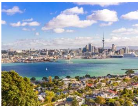
Blick auf Auckland

Im Vitality Spa finden Sie die perfekte Entspannung und alles, was das Wellness-Herz begehrt. Shopping-Freunde kommen in zahlreichen exklusiven Geschäften auf ihre Kosten und das Showprogramm an Bord lässt ebenfalls keine Wünsche offen. Atemberaubende Akrobatik, eine elektrisierende Choreografie, aufwendige Kostüme und hypnotisierende visuelle Effekte. Zwischendurch vielleicht ein Tanzkurs, ein Cocktail an der Bar, schlemmen als gäbe es kein Morgen, eine Runde im Pool schwimmen ... Dieses Schiff ist ein Schlaraffenland!