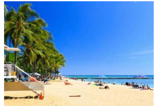
Besuchen Sie die Traumstrände Honolulus

trockene Westküste teilweise einen wüstenartigen Charakter hat, gibt es auf der Nord- und Ostseite eine üppige Vegetation mit Ananas, Papaya, Kakao und anderen Agrarprodukten. Die Strände der Insel sind zahlreich und vielfältig – eines aber haben sie alle gemeinsam: Sie ziehen Strandliebhaber und Wellenreiter aus der ganzen Welt an. Der Waikiki-Strand ist sogar einen der berühmtesten Strände der Welt. Wunderschön ist auch der Waimea Falls Park, ein botanischer Garten mit dem einzigen leicht zugänglichen Wasserfall der Insel. In eine Plantagenlandschaft eingebettet, findet man das Polynesian Cultural Center mit nachgebauten Minidörfern aus sieben Südseeregionen. Die perfekte Kulisse für Shows mit traditioneller Kultur und Handwerk. Im Valley of the Temples befinden sich Gotteshäuser verschiedener Religionen. Sie sehen, Oahu ist eine fantastisch vielfältige Insel – da kommt eine ganztägige Inselrundfahrt doch genau richtig!