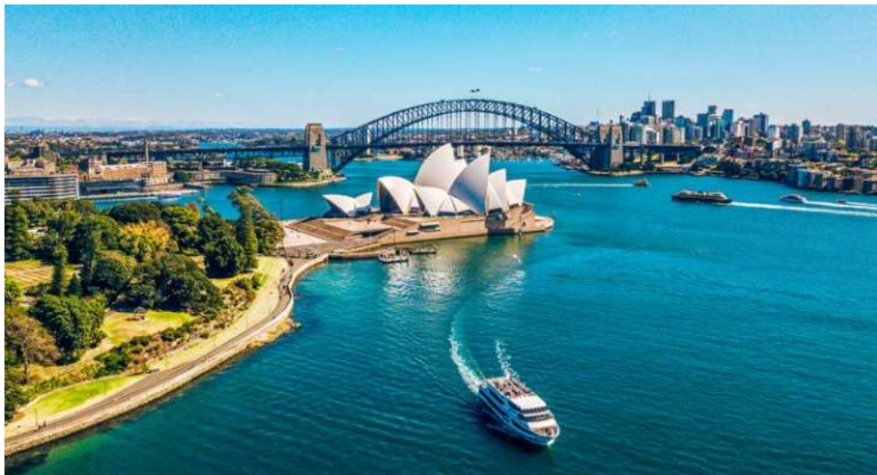
Sydney, eine Stadt, in die man sich unweigerlich verliebt!

nicht zu kurz. Probieren Sie traditionelle italienische Gerichte im Jamie's Italian by Jamie Oliver, amerikanische Steakhaus-Klassiker in zeitgenössischem Flair im Chops Grille und erstklassige Kreationen mit viel Fantasie im Wonderland Imaginative Cuisine.