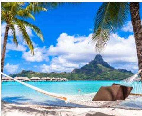
Das Paradies erwartet Sie auf Französisch-Polynesien!

Raiatea bedeutet so viel wie „ferner Himmel“ und ist eine Insel von beeindruckender Schönheit. Hier stoßen Sie auf alte Mythen und den größten Außentempel (Marae) Französisch-Polynesiens. Raiatea liegt in einer ruhigen Lagune und ist von einem Korallenriff, in dem es von buntem Leben nur so wimmelt, umgeben – ideal zum Schnorcheln und Tauchen.