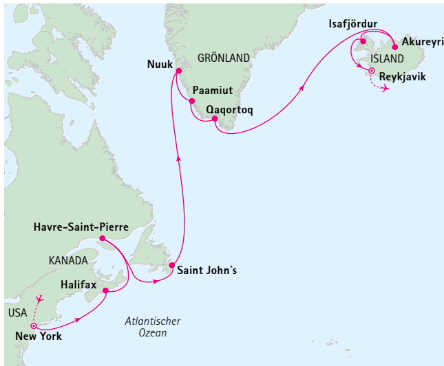
Ihre grandiose Reiseroute