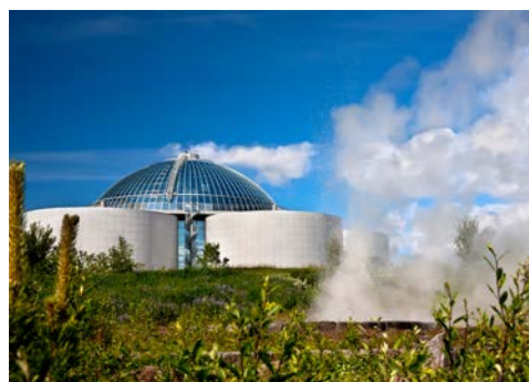
Futuristisch – das Perlan Museum in Reykjavik

Island gilt nicht umsonst als das Traumziel eines jeden Fotografen. Die fantastische Landschaft hält Ausblicke auf Lavaströme, heiße Quellen und unberührte Natur bereit. Inmitten dieser unglaublichen Umgebung liegt Reykjavik, die nördlichste Hauptstadt Europas. Nach der Ausschiffung unternehmen Sie eine Stadtrundfahrt, die Ihnen die wichtigsten Sehenswürdigkeiten der Stadt nahe bringt. Dabei besuchen Sie auch die Aussichtsplattform auf dem Reykjavik Perlan Museum. Schon das Gebäude selbst ist unglaublich – ein futuristisches Meisterwerk. Von oben genießen Sie einen spektakulären 360-Grad-Blick auf Reykjavik, die Halbinsel Reykjanes und den Snæfellsjökull-Gletscher. Danach laden wir Sie zum Mittagessen im beliebten Brauhaus Bryggjans