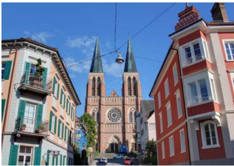
In der Altstadt von Bregenz