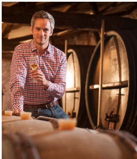
Kosten Sie Weine vom Bodensee

Flug nach Zürich. Am Flughafen werden Sie von Ihrer örtlichen Reiseleitung in Empfang genommen und unternehmen einen Stadtrundgang durch das zauberhafte St. Gallen. Nach einer Mittagspause fahren Sie nach Lindau am Bodensee, wo Sie für die nächsten 4 Nächte Ihr Hotel beziehen. Ein geführter Abendspaziergang durch Lindau beschließt Ihren Tag.