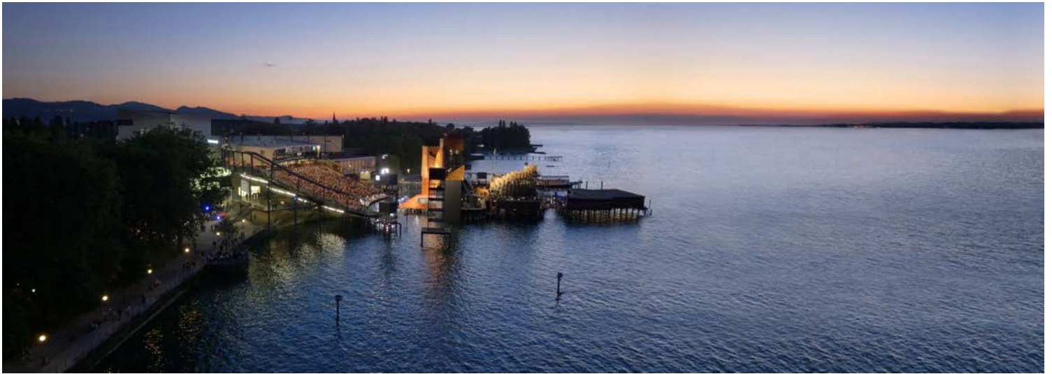
Spektakuläre Seebühne in Bregenz