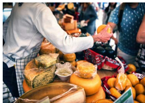
Käsemarkt in Alkmaar

Am frühen Morgen heißt es „Leinen los!“. Erstes Ziel ist Zaanse Schans. Hier beginnt der Ausflug in das reizvolle und durch seinen Käsemarkt bekannte Alkmaar, wo ein gemütlicher Rundgang stattfindet, falls gebucht. Weiterfahrt Richtung Norden.