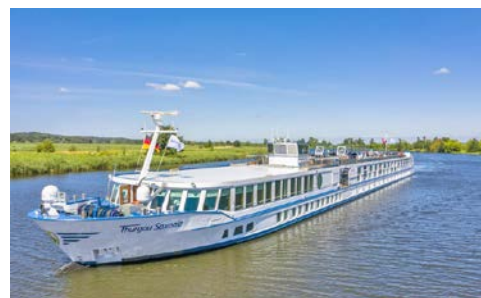
Die THURGAU SAXONIA

Einen detaillierten Deckplan und Informationen zum Schiff sowie zu technischen Hinweisen bei Flussschiffen erhalten Sie im Internet unter der unten angegebenen Adresse.