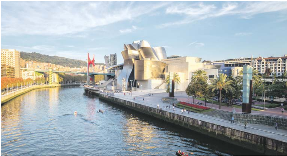
Das berühmte Guggenheim Museum in Bilbao

Hotel zum berühmten Guggenheim-Museum. Das von Frank O'Gehry entworfene Gebäude aus Stahl, Glas, Kalkstein und Titan hat der einstigen Industriestadt am Atlantik ein völlig neues Image gegeben. Direkt am Fluss in der neuen Gegend von Abandoibarra beherbergt das 1997 eröffnete Guggenheim-Museum auf 24.000 m 2 je nach Jahreszeit verschiedene und interessante Wanderausstellungen zeitgenössischer, moderner aber auch klassischer Kunst. Hier können Sie z. B. die Werke von Kandinsky, Marc Chagall, Henri Matisse, Paul Klee, Salvador Dalí, Joan Miró und Juan Gris, Mark Rothko, Anselm Kiefer etc. bewundern. Außerdem sind die permanente Ausstellung mit Skulpturen/Kunstwerken von Richard Serra „The Matter of Time“ sowie die Skulpturen von Jeff Koons und Louise Bourgeois zu sehen. Die Tour endet nach ca. 4 Stunden. Der Nachmittag steht Ihnen zur freien Verfügung.