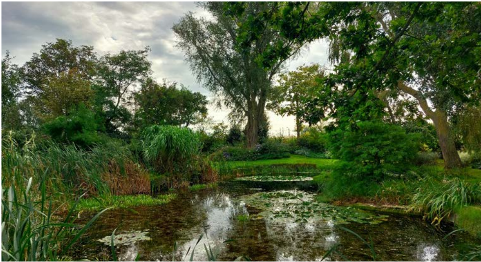
Willkommen im Garten de Wulff