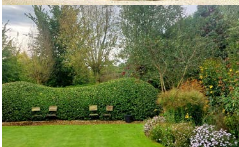
Antwerpen, Grote Markt (oben), Garten Backes (unten)