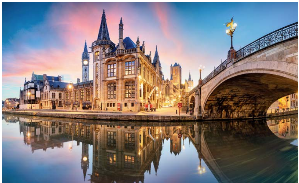
Blick auf die wunderschöne Altstadt von Gent