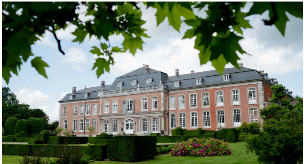
Blick auf Schloss Hex

Daneben dürfen Sie sich auf die durchgehende Begleitung eines komfortablen Reisebusses freuen.