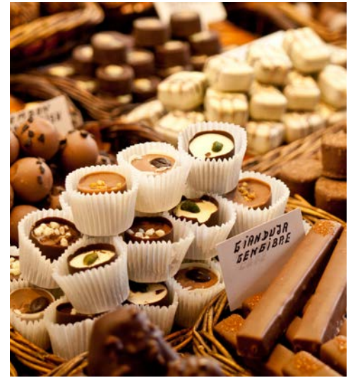
Kosten Sie die berühmten Pralinen