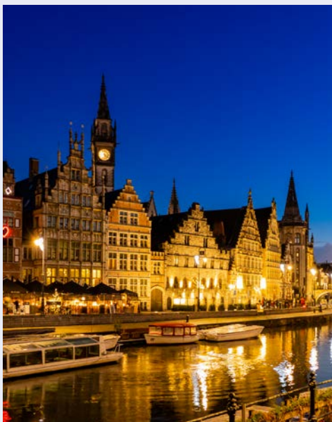
Gent am Abend

Heute widmen Sie sich intensiv der Stadt Gent. Handel und Produktion von Tuchleinen machten die Stadt schon im Mittelalter sehr reich und für europäische Herrscher interessant. Burgunder und Habsburger setzten sich im 15. Jh. als Herrscher durch. Karl der V kam 1500 in Gent auf die Welt und war schon zwanzig Jahre später Kaiser des Heiligen Römischen Reichs Deutscher Nation. Auch in der Moderne war Gent bemerkenswert. Die Industrialisierung auf dem europäischen Festland begann in Gent. Nach London und Paris war sie die dritte europäische Stadt mit einer Gasbeleuchtung. Nach einem entspannten Frühstück lernen Sie bei einer privaten Bootsfahrt die historische Stadt Gent zunächst vom Wasser aus kennen. Neben spannenden Details werden auch „Hapjes en Drankjes“ gereicht, ein kleiner belgischer Imbiss mit original belgischem Bier und natürlich belgischer Schokolade! Nach der Bootsfahrt erkunden Sie die Altstadt mit einem lokalen Stadtführer und besuchen die berühmte Kathedrale Sint Baafs mit dem weltberühmten Genter Altar. Der Abend bleibt zur freien Verfügung.