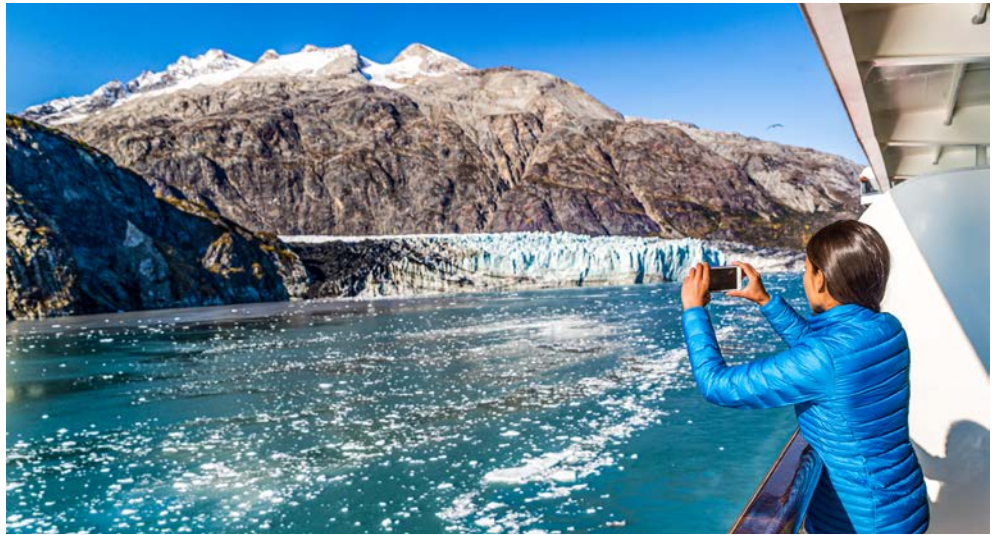
Beeindruckende Glacier Bay