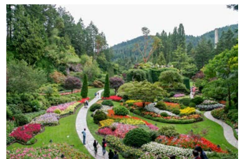
Impressionen im Butchart Gardens

Mit der Fähre setzen alle Ausflugsteilnehmer über die Strait of Georgia nach Vancouver Island über. Sie besuchen Victoria, die Hauptstadt der Provinz British Columbia, am Südende der Insel gelegen. Zunächst besuchen Sie die bekannte Gartenanlage Butchart Gardens. Auf über 22 Hektar erwartet Sie hier ein Paradies für Gartenliebhaber, Fotografen und Romantiker. Verschlungene Pfade führen durch den Park, der ganzjährig durch 50 Gärtner liebevoll gestaltet wird. Im Anschluss lernen Sie die Stadt auf einer Rundfahrt kennen und kommen vorbei an The Empress, einem altherwürdigen Hotel, dem Parlamentsgebäude, Beacon Hill Park und dem Thunderbird Park, einem Wald aus Totempfählen.