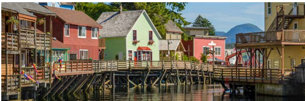
Ketchikan ist eine ganz besondere Stadt