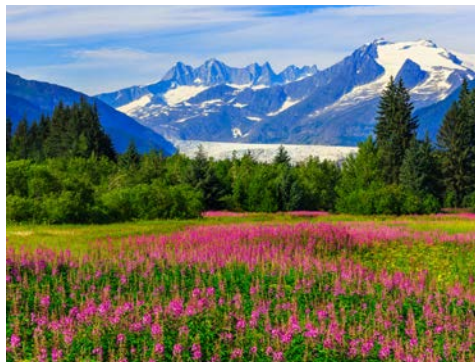
Die Umgebung von Juneau

Der Tracy Arm ist ein enger Fjord mit steilen, bis zu 1.000 m hohen Felswänden, Gletschern und Wasserfällen in Alaska, südlich von Juneau gelegen. Gegen Mittag erreichen Sie Juneau, die Hauptstadt Alaskas, malerisch am Fuße des 1.164 m hohen Mount Roberts gelegen. Hier können Sie u. a. auf den Spuren der Stadtgründung wandeln: Im Jahre 1880 fanden Joe Juneau und Richard Harris am Gastineau Channel Gold, was zur Gründung der heutigen Stadt führte. Zahlreiche Ausflugsmöglichkeiten bieten Ihnen Gelegenheit die einzigartige Umgebung kennenzulernen.