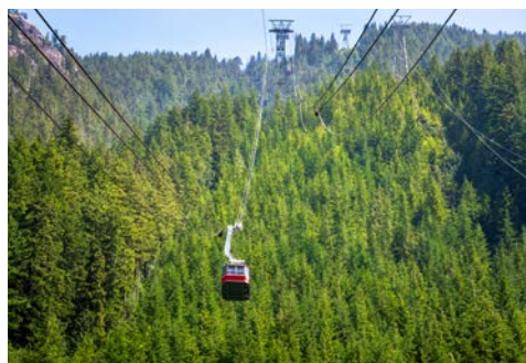
Per Seilbahn auf den Grouse Mountain

Sie erwachen in einer der schönsten Städte der Welt – Vancouver! Urbanität und grandiose Naturerlebnisse verbinden sich hier in Harmonie. Ist sie auch die größte Stadt im westlichen Kanada, in British Columbia gelegen, strahlt Vancouver doch eine einladende und offene Atmosphäre aus. Berge, Wald, Großstadt und Meer – dank ihrer Lage zwischen den zerklüfteten Coast Mountains und dem Pazifik können Sie am Strand spazieren gehen, auf dem Grouse Mountain wandern, Robben, Orcas oder Buckelwale in der Vancouver Bay beobachten ... Es gibt so viele Möglichkeiten. Der Stanley Park, die „grüne Lunge“ der Stadt, ist ein beliebtes Ziel für Reisende