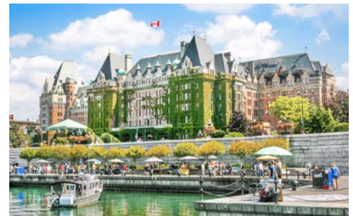
Besuchen Sie Victoria

und Einheimische. Auf Granville Island, einem einzigartigen Touristenmagneten, haben sich Künstler und Handwerker mit ihren kleinen Ateliers und Geschäften angesiedelt. Musik und Straßenkünstler sowie die Markthalle, wo Sie Spezialitäten frisch aus der Region erwerben können, runden das „Greenville Erlebnis“ ab.