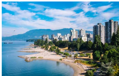
Schlendern Sie am Strand entlang

Ihre Reise beginnt mit dem Flug nach Vancouver. Am Flughafen werden Sie von Ihrer Deutsch sprechenden Reiseleitung empfangen und es erfolgt der Transfer zu Ihrem Hotel.