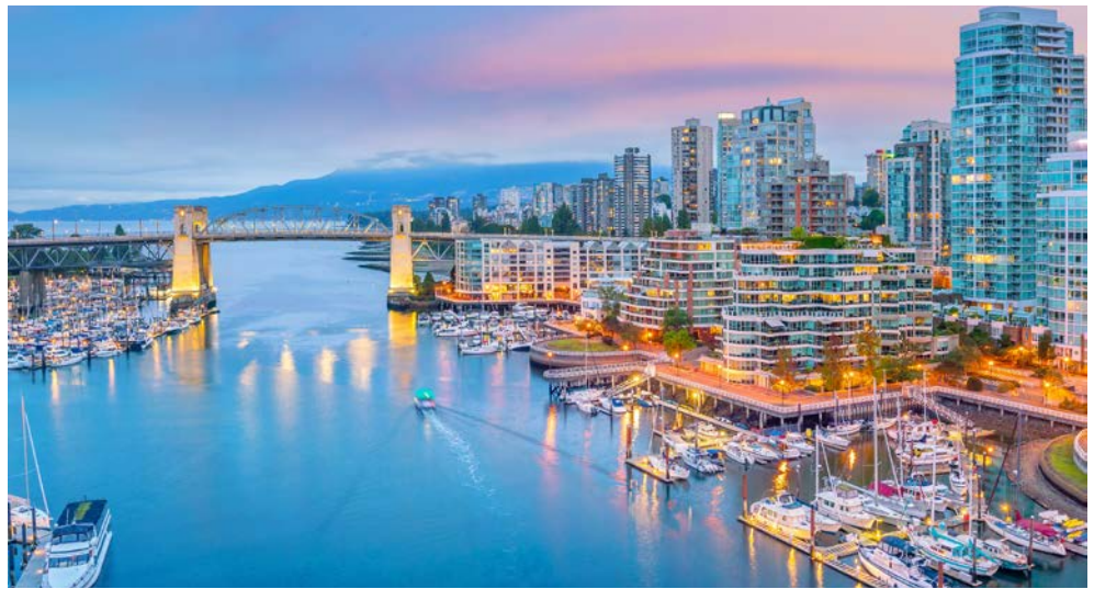
Skyline von Vancouver