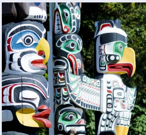
Die Totempfähle Vancouvers