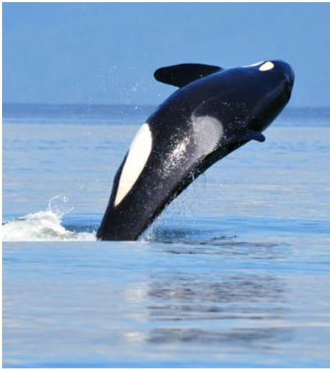
Mit etwas Glück können Sie Orcas beobachten