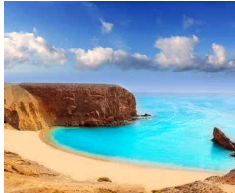
Papageienstrand auf Lanzarote

den Jameos del Agua, ein Zentrum für Kunst und Kultur geschaffen.