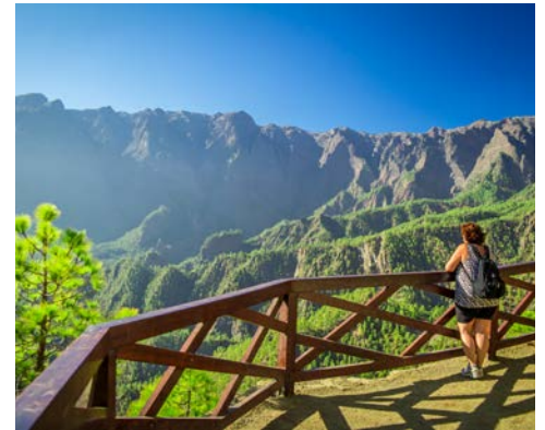
Nationalpark Caldera de Taburiente auf La Palma