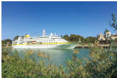
Die HAMBURG in Sevilla