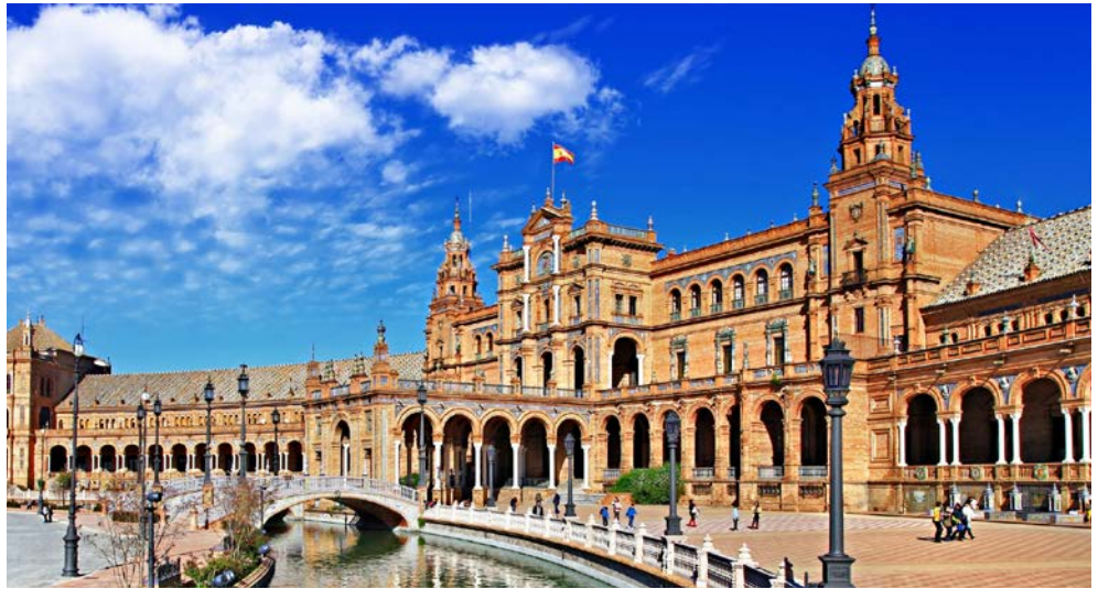
Willkommen in Sevilla