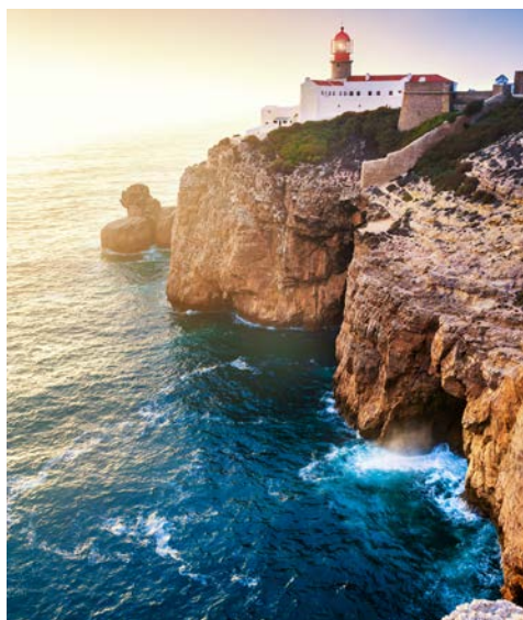
Leuchtturm am Cabo de São Vicente an der Algarve

Portimão ist ein beschauliches Städtchen an der Algarveküste mit herrlichen Stränden. In der Nähe befindet sich das 62 m hohe Cabo de São Vicente, die Südwestspitze Europas. Hier steht der lichtstärkste Leuchtturm des Kontinents