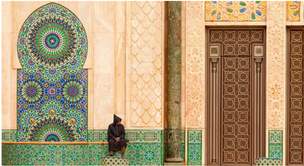
Casablanca – Moschee Hassan II