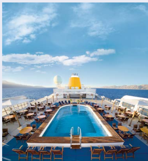
Entspannte Zeiten an Deck

Transfer Bahnhof-Flughafen-Bahnhof in Eigenregie.