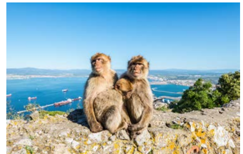
Berberäffchen auf Gibraltar

Wie wäre es heute mit einem Ausflug nach Jerez de la Frontera um beispielsweise die Spanische Hofreitschule zu besuchen und natürlich um einen der berühmten Sherrys zu kosten?