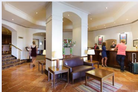
An der Rezeption