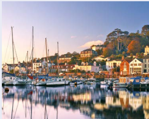
St. Aubin – wunderschön am Hafen gelegen

Ein Stück Frankreich, das ins Meer gefallen ist und von England aufgesammelt wurde: So beschrieb Victor Hugo die Kanalinseln. Aus dem Spannungsfeld zwischen den beiden großen Kulturnationen ergeben sich immer wieder faszinierende und anziehende Gegensätze: zum Beispiel französischer Charme und britische Exzentrik, Herrenhäuser in viktorianischem oder Tudorstil und normannische Bauernhäuser, die exzellente französische Küche und Fish & Chips am Meer. Wer Kulturdenkmäler sucht, findet sie in überreichem Maße: von Menhiren über mittelalterliche Burgen bis zu Relikten aus dem 2. Weltkrieg. Für Naturfreunde sind die Inseln ebenfalls kleine Paradiese. Endlos weite weiße Sandstrände wechseln sich mit spektakulär schroffen Klippen ab. Auf den Inseln wachsen Palmen, genauso wie Hortensien, üppige Rosen, Ginster, Mimosen und Kamelien. Aber das vielleicht Schönste ist, dass hier Entdecker unter sich sind, weil die Kanalinseln vom Massentourismus bis jetzt immer noch verschont blieben.