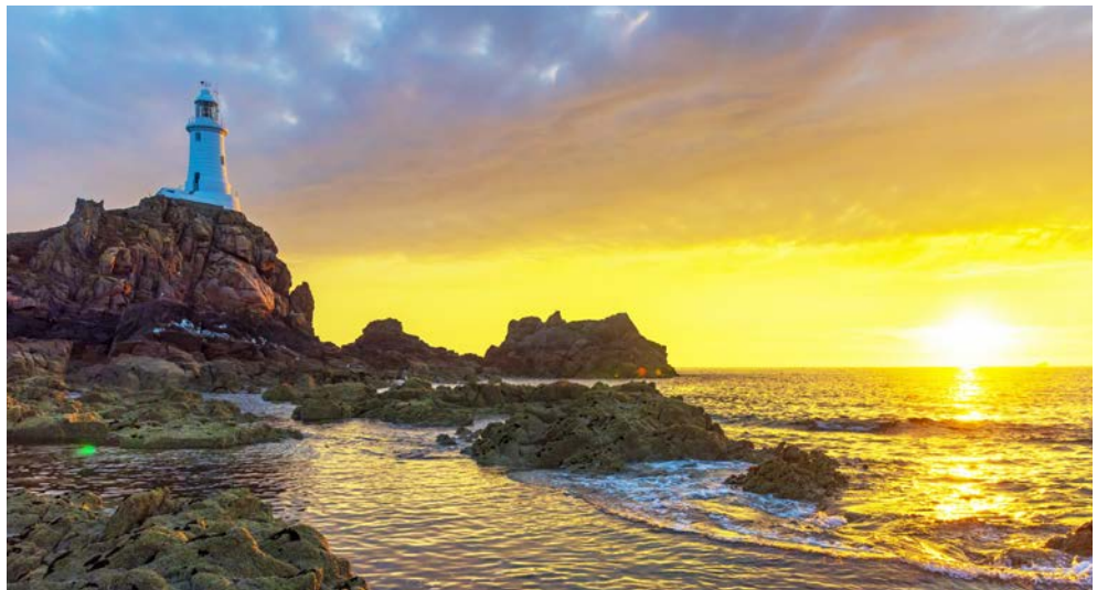
Leuchtturm La Corbière