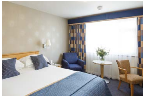
Zimmerbeispiel im Hotel