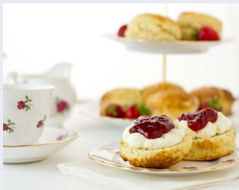
Scones mit Cream Tea – einfach lecker

11.05.-18.05.2024 ab/bis Hannover 18.05.-25.05.2024 ab/bis Bremen 25.05.-01.06.2024 ab/bis Braunschweig 01.06.-08.06.2024 ab/bis Berlin 08.06.-15.06.2024 ab/bis Berlin 15.06.-22.06.2024 ab/bis Bremen 22.06.-29.06.2024 ab/bis Nürnberg 03.08.-10.08.2024 ab/bis Hannover 10.08.-17.08.2024 ab/bis Berlin 17.08.-24.08.2024 ab/bis Hamburg 21.09.-28.09.2024 ab/bis Nürnberg