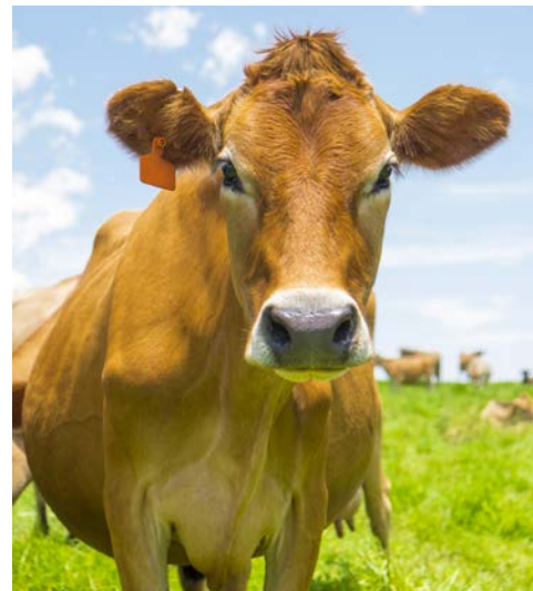
Das Jersey Rind, eine der ältesten Rinderrassen der Welt