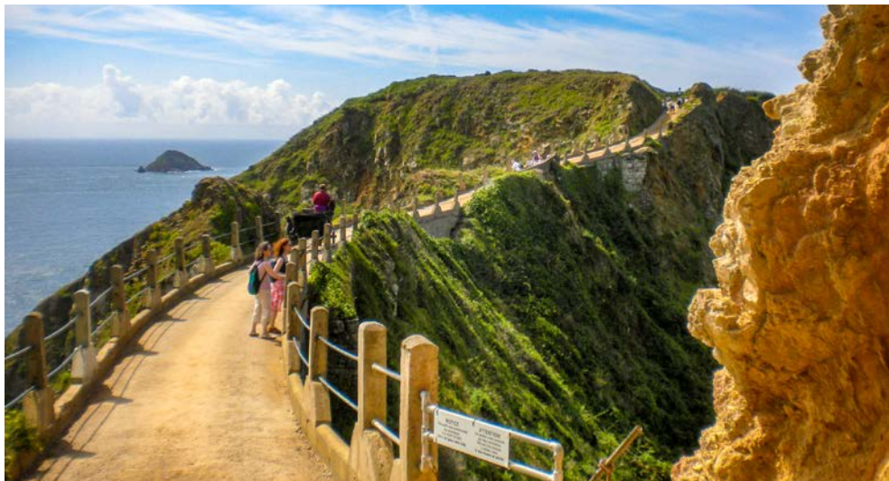
La Coupée – spektakulärer Übergang zwischen Sark und Little Sark

von Grosnez Castle an der nordwestlichsten Ecke der Insel zum Samarès Manor, einem der wenigen öffentlich zugänglichen Feudalsitze. Die ältesten Teile des Gebäudes stammen genauso wie der imposante „Columbier“ (ein Taubenturm) aus dem 12. Jahrhundert, der 1920 angelegte Park bezaubert mit seinem japanischen Wassergarten, mit Dschungelpfad, Brautweg und Weidenlabyrinth, Rosen-, Lavendel- oder Kräutergarten mit phantasievollen Rankgerüsten für die verschiedensten Apfelsorten (ca. 55 km).