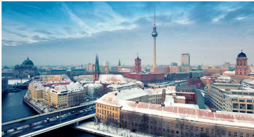
Herzlich Willkommen in Berlin

Sie möchten Weihnachten nicht zu Hause verbringen, sondern lieber im geselligen Kreis, in festlicher Ambiente und mit einem stilvollen Rahmenprogramm? Begleiten Sie uns über die Feiertage in die festlich geschmückte Hauptstadt. Besonders in der Weihnachtszeit erstrahlt die Stadt im Lichterglanz und die Prachtboulevards Unter den Linden und der Kurfürstendamm werden mit beeindruckenden Installationen illuminiert. Der Ausgangspunkt für Ihre Weihnachtsreise könnte besser nicht gewählt sein, denn Sie wohnen im Maritim proArte Hotel direkt an der Friedrichstraße. Hier erwarten Sie kulinarische Genüsse und zudem befindet sich das Hotel fußläufig zu vielen weiteren Sehenswürdigkeiten, wie dem Brandenburger Tor, dem Alexanderplatz und dem Berliner Dom. Neben einem Konzert im Bode-Museum besuchen Sie auch die Grand Show im Friedrichstadt-Palast.