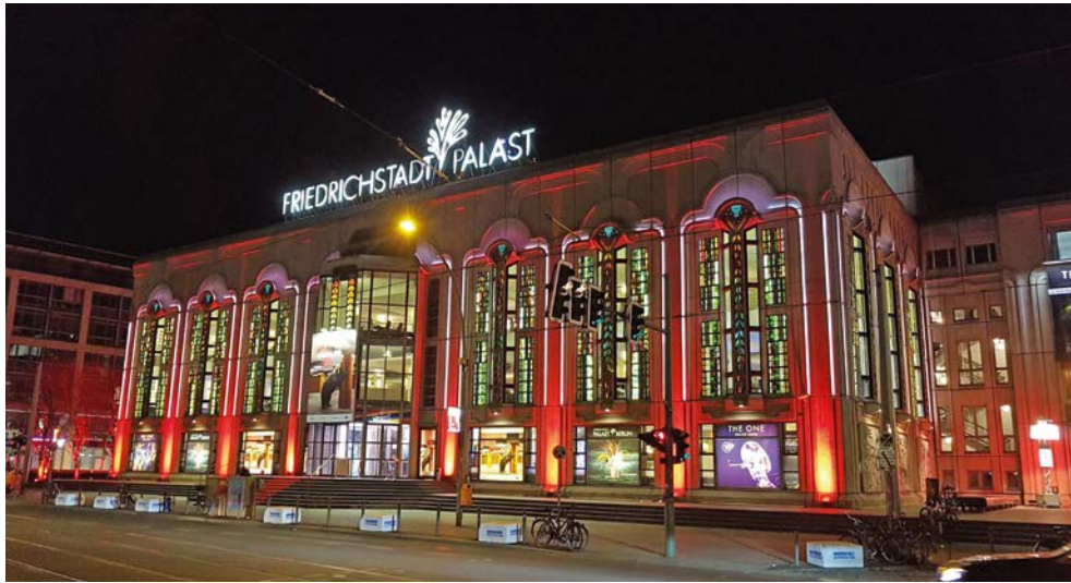
Der Friedrichstadtpalast in Berlin