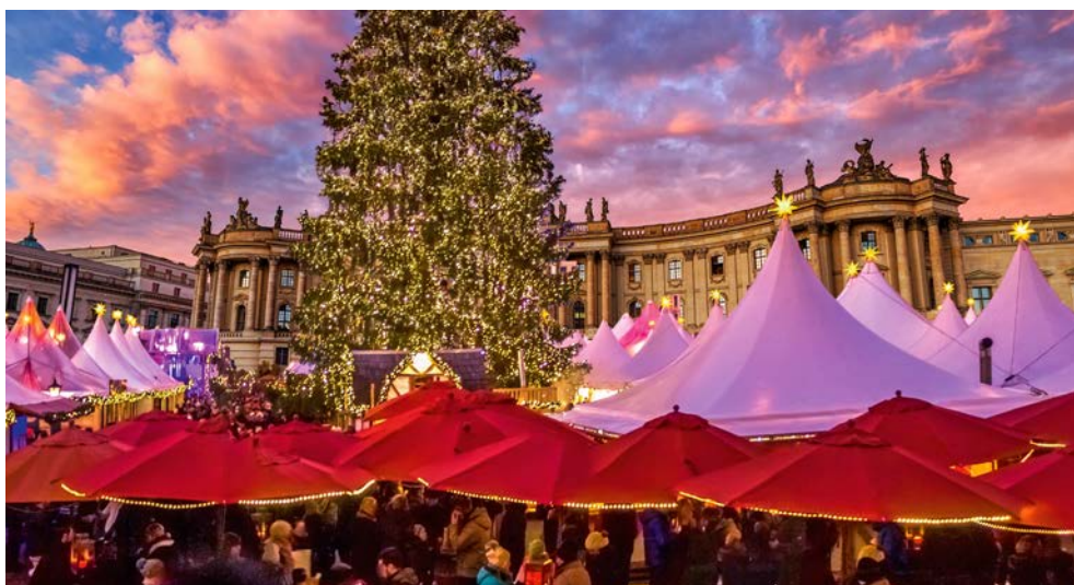
Der stimmungsvolle Weihnachtsmarkt am Bebelplatz