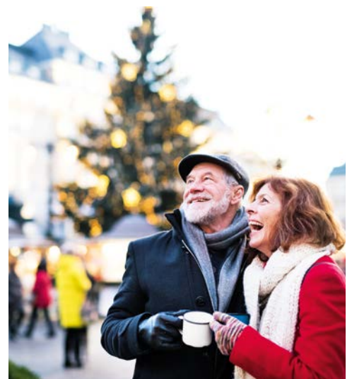
Genießen Sie schöne Tage in Berlin