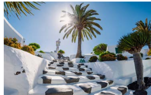
Museo del Campesino auf Lanzarote

Was für eine Insel der Gegensätze! Kilometerlange, weißsandige Strände, voller farbenfroher Tupfer von jenen. Das Surferparadies Fuerteventura wird Sie mit vielen verschiedenen Facetten begeistern. Dementsprechend ist auch das vom Passatwind geschliffene, sandfarbene Hügelland im Inneren der Insel geprägt von weiß getünchten Windmühlen und uralten, aber intakten Wasserschöpfprädern, die der kargen Wüstenlandschaft immer wieder grüne Oasen voll überbordender Fruchtbarkeit abtrotzen. Entdecken Sie die Insel für sich und probieren Sie unbedingt den typischen Käse und ein Glas Sangria.