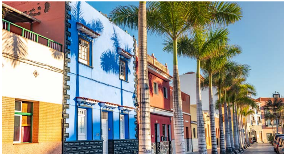
Teneriffa – Puerto de la Cruz

Freuen Sie sich auf eine beeindruckende Reisekombination: Zunächst erleben Sie erholsame Tage in Puerto de la Cruz auf Teneriffa in einem charmanten 4-Sterne Hotel am Atlantik. Mit dem Ganztagesausflug erleben Sie die Inselattraktionen Teneriffas inklusive Tapas Snack. Als nächstes wartet eine abwechslungsreiche Kreuzfahrt mit unvergesslichen Erlebnissen auf Sie: Die Prunkstücke der Kanaren wollen von Ihnen entdeckt werden. Dabei lacht Ihnen die Sonne zu, das Meer wiegt Sie sanft auf Ihrer Sonnenliege oder in Ihrer komfortablen Kabine in den Schlaf. Es wartet eine paradiesische Natur auf Sie mit wunderschönen Stränden und Buchten, zauberhaften Städten sowie einer einmaligen Vegetation. Langeweile kommt auf AIDAcosma garantiert nicht auf, wenn Sie das abwechslungsreiche Showprogramm im Theatrium oder die verschiedenen Sport- und Wellnessangebote wahrnehmen.