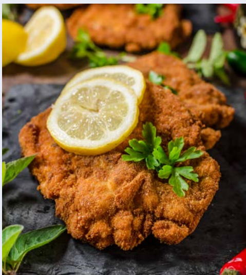
Typisch Wiener Schnitzel

Volksliedern. Lassen Sie sich vom charismatischen Publikumsliebbling zu einem rauschenden Walzer auf den Gängen hinreißen. André Rieu steht für Liebe zur Musik und deren Vielfalt. Der sympathische Entertainer ist ein Musiker durch und durch. Erleben Sie einen unvergesslichen Abend und überzeugen Sie sich selbst, weshalb André Rieu bereits seit Jahren zu den weltweit beliebtesten Live-Acts gehört. Die Moderation des Abends erfolgt voraussichtlich