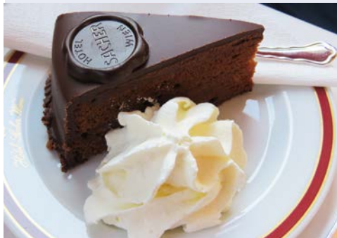
Klassiker: Die Sachertorte

Der Walzerkönig André Rieu hat klassische Musik für Millionen von Menschen auf der ganzen Welt zugänglich gemacht. Kein anderer Klassik-Künstler hat vor so vielen Menschen gespielt und seine Besucherzahlen übertreffen regelmäßig die größten Pop- und Rockstars. Obwohl André Rieu in vielen Orten der Welt auftritt, ist sein jährliches Konzert in Wien eines seiner beliebtesten – denn nirgendwo sonst ist der Stargeiger mit seinem Johann Strauß Orchester so eng mit einer Stadt verbunden wie in der Donaumetropole. Lassen Sie sich von der imperialen Atmosphäre Wiens bezaubern und erleben Sie den begnadeten Entertainer und sein Johann Strauss Orchester in der Walzermetropole. Seine romantisch-fröhlichen Konzertprogramme stehen für pure Emotionen und Weltklasse-Entertainment und setzen auf Inszenierungen vom Feinsten – angefangen beim Einzug durch den Zuschauerraum auf die Bühne bis hin zu den aufwändigen Kostümen und der riesigen Leinwand mit wunderschönen Bildfolgen. Zusammen mit einem ausgewählten Begleitprogramm wird diese Konzertreise zu einem unvergesslichen Aufenthalt in Österreichs geschichtsträchtiger Metropole.