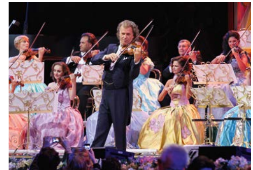
Freuen Sie sich auf André Rieu!

vom Hotel zur Wiener Stadthalle. Dann ist es endlich soweit und Sie erleben André Rieu live auf der Konzertbühne. Schließen Sie die Augen und lauschen Sie berühmten Wiener Operettenmelodien und bekannten Musical-Songs bis hin zu beliebten