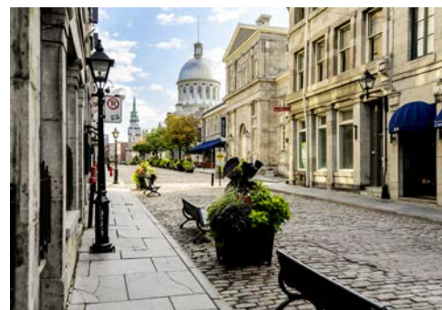
Sie wähen sich in Paris? Nein, das ist Montréal!