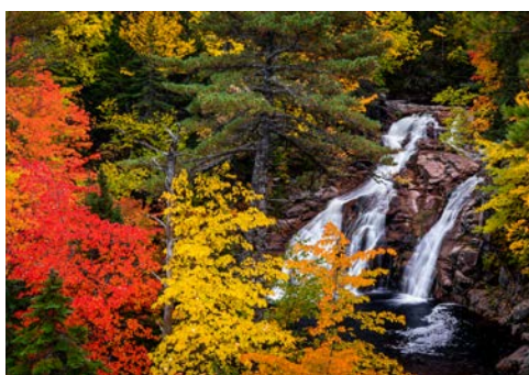
Natur pur auf Cape Breton Island