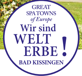
Die sommerliche Fahrt ins Bad – erleben Sie Bad Kissingen zur schönsten Jahreszeit!