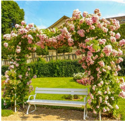
Genießen Sie die Blütenpracht in Bad Kissingen