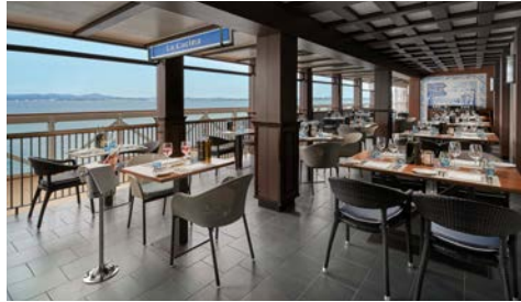
Restaurant La Cucina – Außenbereich

Bordwährung: US-Dollar. An Bord benötigen Sie kein Bargeld. Für den Fall, dass Sie keine Kreditkarte hinterlegen können, wird um eine Vorauszahlung in bar oder in Form eines Reiseschecks in Höhe von USD 450,- p.P. gebeten (vorbehaltlich Änderungen).