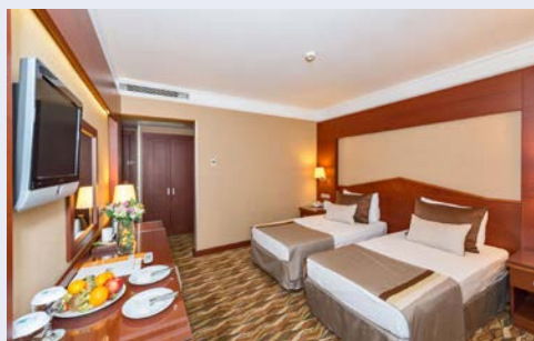
Zimmerbeispiel im Hotel Vicenza

Termine 24.09. und 22.10.: Das Vicenza Hotel (Landeskategorie: 4 Sterne) empfängt Sie in modernen Zimmern im Herzen von Istanbul. Vom Pool auf der Dachterrasse genießen Sie eine weitreichende Aussicht auf das historische Stadtzentrum (nur in den Sommermonaten in Betrieb). Darüber hinaus lädt auch der Innenpool zum Entspannen ein. Die Metrostation Vezneciler ist nur ein paar Schritte entfernt. Die klimatisierten Zimmer im Hotel Vicenza verfügen über eine moderne Einrichtung mit Holzmöbeln. Ein Flachbild-Sat-TV und eine Minibar sind ebenfalls in den Zimmern vorhanden. In jeder Unterkunft steht zudem Tee- und Kaffeezubehör für Sie bereit. Das À-la-carte-Restaurant Venezia serviert Ihnen frische Meeresfrüchte sowie osmanische und italienische Gerichte. Im Café & Bar Vittoria werden Sie mit leichten Mahlzeiten, Snacks und Getränken verwöhnt. Erholen Sie sich zudem bei einer entspannenden Massage oder besuchen Sie die Sauna im Wellnesscenter Alpheus. Ein traditionelles Türkisches Bad und ein Fitnesscenter runden das Angebot ab.