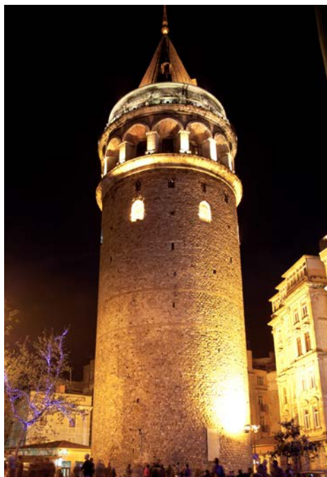
Der illuminierte Galataturm