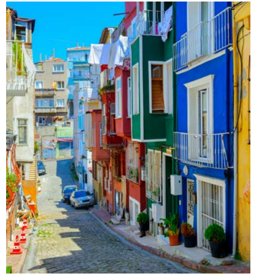
Auch das ist Istanbul – bunte Fassaden in der Altstadt