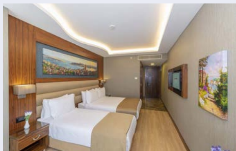
Zimmerbeispiel im Piya Sport Hotel

Termin 01.10.: Das Piya Sport Hotel (Landeskategorie: 4 Sterne) liegt mitten im Herzen der Altstadt von Istanbul, ca. 500 m vom Großen Basar entfernt. Die Hagia Sophia, die Blaue Moschee, das Topkapi Palast Museum, das Hippodrom, Süleymaniye Moschee sowie die Untergrund Zisterne sind nur wenige Gehminuten entfernt. Die komfortablen Zimmer mit moderner Ausstattung, verfügen über einen Flachbild-Sat-TV, kostenfreies WLAN und Klimaanlage. Außerdem gibt es einen Schranksafe und eine Minibar. Im Piya Sport Hotel können Sie sich in der Sauna oder im türkischen Bad entspannen oder gegen Aufpreis eine wohltuende Thai-Massage genießen. Desweiteren stehen Ihnen ein Indoor- und ein Outdoor Pool (nur in den Sommermonaten in Betrieb) sowie ein Fitnessraum zur Verfügung. Das tägliche Frühstück wird in Buffetform serviert und bietet eine große Auswahl an Speisen. Im Hotelrestaurant mit Blick auf das Marmara Meer kann man ausgewählte Gerichte der türkischen und internationalen Küche kosten.