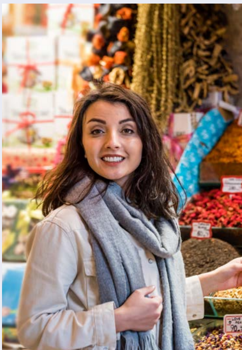
Auf dem Basar

Dieser Tag steht Ihnen zur freien Verfügung. Erkunden Sie die Stadt in Eigenregie oder nehmen Sie am optionalen Ausflug teil. Zunächst fahren Sie über die Hängebrücke zur asiatischen Seite der Stadt. Vom Camlica Hügel aus hat man einen traumhaften Blick auf die ganze Stadt. Nach einem Spaziergang auf dem Markt von Üsküdar unternehmen Sie eine wunderschöne Schiffsfahrt auf dem Bosphorus. Hier werden Sie sich den Palastanlagen entlang zwischen den Kontinenten bewegen. Anschließend besuchen Sie die Hagia Sophia aus dem 6. Jhr., die zu den größten Kirchen der Welt zählt. In dieser Kirche befand sich der „Nabel der Welt“, nach einer mythologischen Vorstellung der Weltenmittelpunkt.