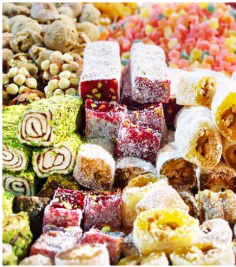
Leckereien auf dem Basar

Spaziergang durch die hinteren Gassen der Altstadt wandern Sie zum Großen Basar. Sie besuchen die Galerie einer bekannten Handwerkerfamilie. Heute haben Sie genügend Zeit, um die berühmten Produkte der Türkei wie Teppiche, Leder- und Schmuckwaren, Textilien oder Gewürze einzukaufen. Im Gewürz-Basar werden Sie die Düfte des Orients genießen. Von der Galata Brücke aus werfen Sie einen Blick auf das Goldene Horn und den Bosphorus.