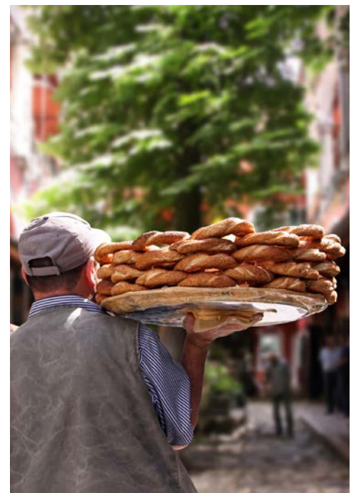
In der Altstadt