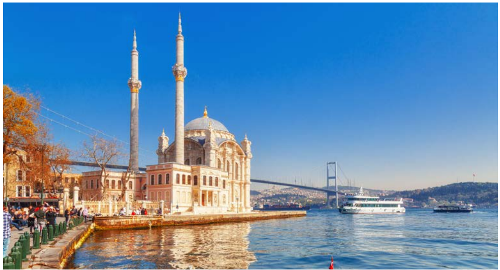
Ortaköy-Moschee am Bosphorus