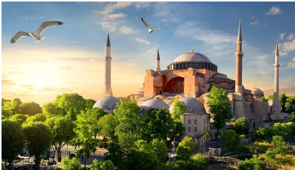
Die Hagia Sophia

Nach dem Frühstück besichtigen Sie das Gesellen-Werk des berühmten Hofarchitekten Sinan. Die Süleymaniye Moschee aus dem 16. Jhr. wird Ihnen die Bescheidenheit der vollkommenen Kunst der klassisch-osmanischen Periode näher bringen. Bei einem