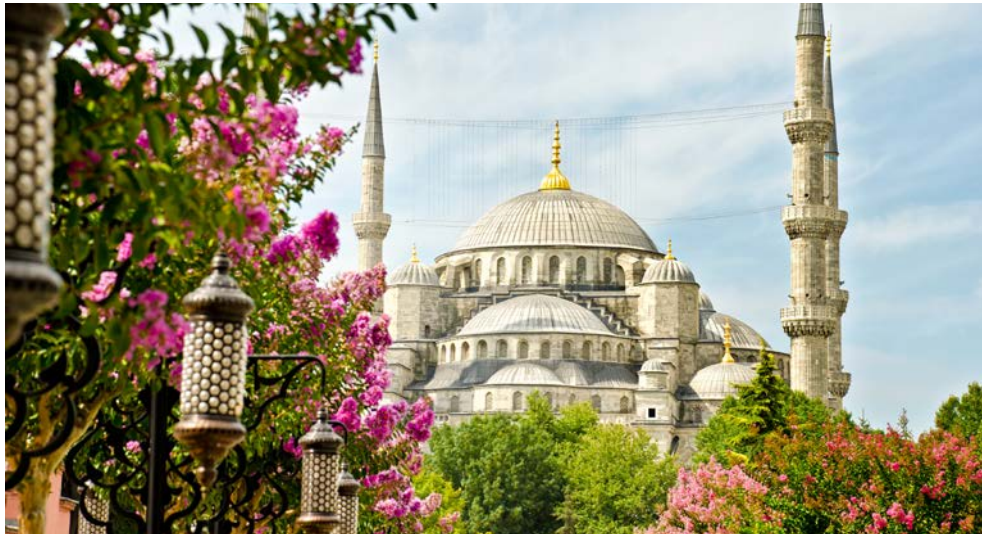
Die Blaue Moschee