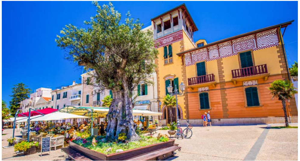
Die Altstadt von Alghero

„Sardinien, das keinem anderen Ort gleicht“, schrieb D. H. Lawrence 1919 über die zweitgrößte der Mittelmeerinseln – und auch ihre Bewohner sind einzigartig. Vor 3.000 Jahren schützten die Sarden sich in Nuraghen vor ihren Feinden. 7.000 der bronzezeitlichen Kastelle soll es gegeben haben und noch heute prägen sie das Bild der Insel. Da ist aber auch die phönizische Siedlung Tharros aus dem 8. Jahrhundert v. Chr., die von den Römern später überbaut wurde – und mehr als 100 romanische Kirchen, gotische Kapellen und die Kathedrale Santa Maria. Auch wenn die Insel zur Siesta typisch italienisch lahm liegt, die Jugend auf Rollern durch die Städte fährt und Cappuccino und Chianti auf jeder Getränkekarte stehen, lässt sie sich nicht mit dem Festland vergleichen. Nicht nur 11 Fahrstunden liegen zwischen Genua und der nördlichen Inselfspitze – sondern Welten.