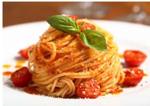
Genießen Sie einen Teller Spaghetti

Nachmittag erreichen Sie wieder Baja Sardinia und spazieren zurück zum Hotel. Abendessen und Übernachtung im Hotel.