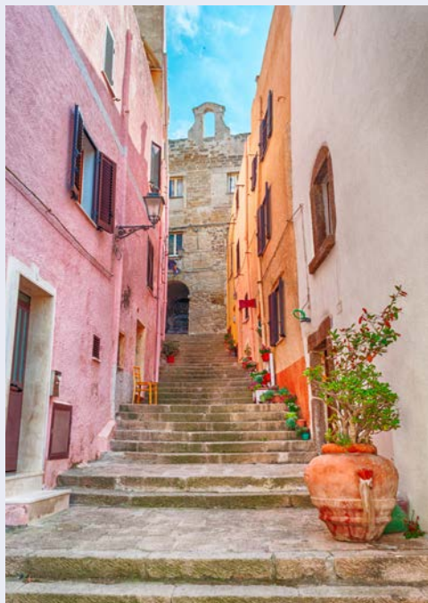
Malerische Gasse in Castelsardo

Frühstück im Hotel. Dieser Tag steht zu Ihrer freien Verfügung: zum Erholen oder für Unternehmungen auf eigene Faust. Abendessen und Übernachtung im Hotel.