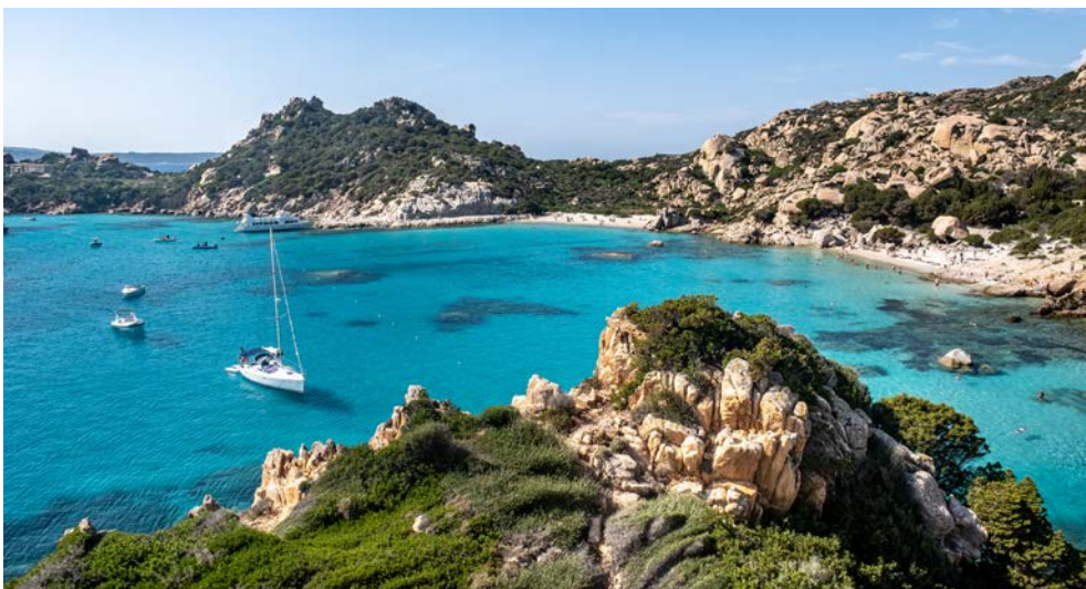
Herrlich ... Isola di Spargi