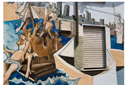
Wandmalerei „Murales“ in Orgosolo

Frühstück im Hotel. Der heutige Tag steht Ihnen zur freien Verfügung. Entspannen Sie in der Hotelanlage, nutzen Sie die Zeit für eigene Entdeckungen und Aktivitäten, oder nehmen Sie an dem Zusatzausflug zur Westküste der Insel teil. Es geht durch die Ausläufer des Gallura-Gebirges an die Westküste der Insel. Zwischendurch machen Sie einen kurzen Stopp bei Sassari und besichtigen die berühmte romanische Kirche mit ihren Fresken aus dem 13. Jahrhundert. Später erreichen Sie Alghero, ein bekanntes Seebad mit einem unendlich langen Sandstrand, der die ganze Bucht umsäumt. Nach einem Bummel durch die gut erhaltene, mittelalterlich anmutende Altstadt haben Sie noch genügend freie Zeit für eigene Unternehmungen. Am späten Nachmittag kehren Sie in Ihr Urlaubsdomizil zurück. Abendessen und Übernachtung im Hotel.