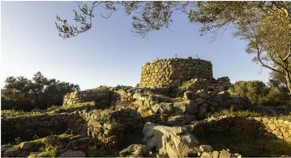
Das antike Bauwerk Nuraghe La Prisgiona