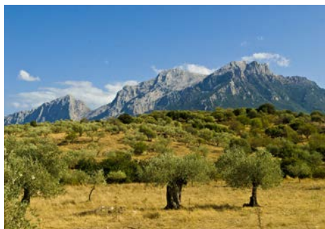
Bergwelt von Gennargentu – und eine große Baumvielfalt