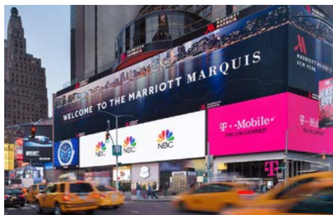
Das New York Marriott Marquis liegt „mittendrin“

Erleben Sie die lebendige Atmosphäre Manhattans im neu renovierten New York Marriott Marquis direkt am Times Square. Das Haus bietet eine perfekte Anbindung zu den Sehenswürdigkeiten der Stadt. Gönnen Sie sich herzhaftes New Yorker Gerichte dank der innovativen Speisekarte in den neu gestalteten Restaurants, zu denen auch der einzige rotierende Speiseraum der Stadt mit Rundblick auf Manhattan zählt. Entspannen Sie sich in den geräumigen Zimmern, die mit modernen Annehmlichkeiten und einem atemberaubenden Blick auf den Broadway und den Times Square begeistern.