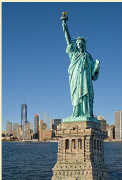
Freiheitsstatue vor Manhattan

Die älteste Stadt Kanadas besticht durch ihre Freundlichkeit – und überwältigende Aussichten! Unternehmen Sie eine Kajakfahrt, beobachten Sie Wale oder schlendern Sie durch die George Street mit ihren zahlreichen Bars und Restaurants. Auch die Preiselbeer-Muffins (eine Spezialität Neufundlands) und die nationalhistorische Stätte Cape Spear sollten Sie sich nicht entgehen lassen.