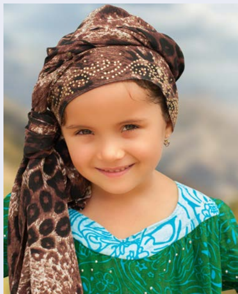
Willkommen in einer anderen Welt