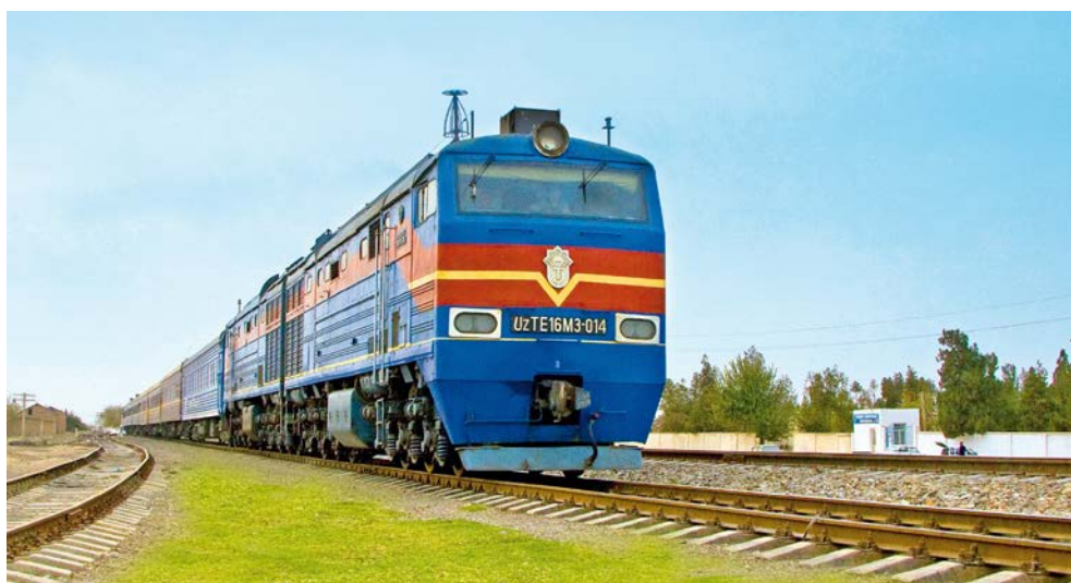
Orient Silk Road Express