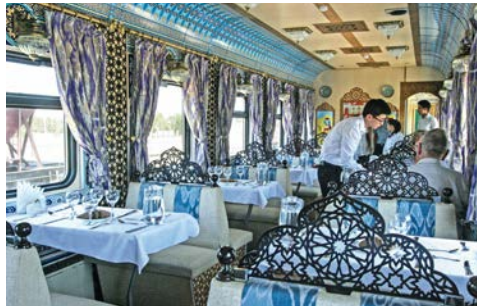
Speisewagen an Bord