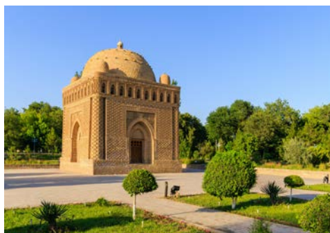
Samaniden-Mausoleum in Buchara

Heute besichtigen Sie die Oase Chiwa – ein Stein gewordenes Märchen aus 1001 Nacht. Sie stehen vor der mächtigen Stadtmauer Chiwas mit ihren Toren und Bastionen aus Lehmziegeln und glauben sich in eine andere Welt versetzt: Rund um das Kalta Minor-Minarett pulsiert auch heute noch das Leben wie in alten Zeiten. Bei einem Rundgang können Sie alle