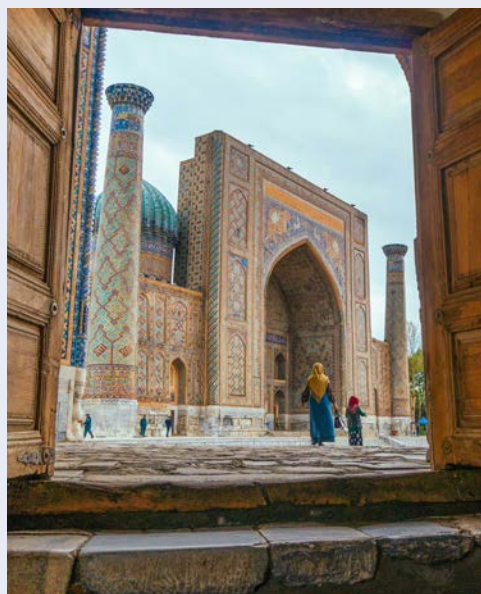
Der Registan Platz in Smarkand