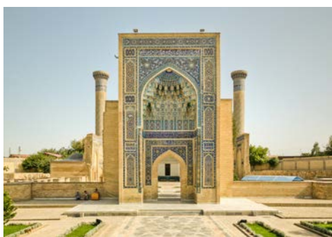
Gur Emir-Mausoleum in Samarkand

Ihrem Sonderzug zurück und machen sich auf in Richtung Samarkand. (FMA)