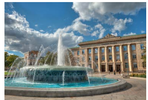
Paris? Wien? Nein, das ist Rousse

Die Festung Kalemegdan liegt hoch über der Stadt und ist das Wahrzeichen Belgrads. Genießen Sie von der Festung aus einen herrlichen Panoramablick auf den Zusammenfluss von Save und Donau, sowie auf Neu-Belgrad. In den Gassen der Altstadt pulsiert das Leben. Jugendstil- und Gründerzeithäuser bilden die Kulisse für schicke Cafés, Restaurants und Boutiquen. Den Abend können Sie beschwingt und farbenfroh ausklingen lassen: Eine der besten serbischen Folkloregruppen bietet Ihnen mit Herz und Freude eine Folkloreaufführung der Extraklasse. Freuen Sie sich auf serbischen Wein, Musik und Tänze. Den Abschluss dieses schwungvollen Abends bildet eine kurze Lichterfahrt durch das abendliche Belgrad.