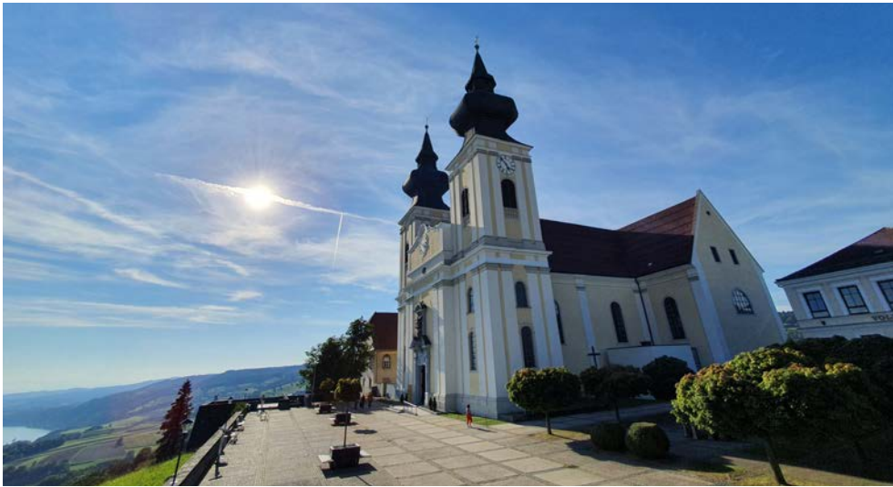
Wallfahrtsbasilika Maria Taferl