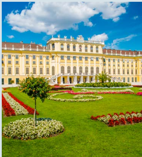
Schloss Schönbrunn in Wien