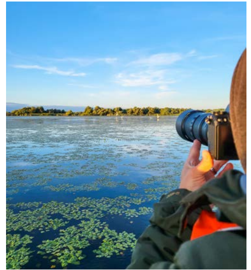
Die Naturwunder des Donaudeltas im Blick

einzigartige Flora und Fauna in den Bann zieht. Das Donaudelta trägt den Titel des UNESCO-Weltnaturerbes. Das Schutzgebiet ist Biosphärenreservat und bildet sowohl das größte Feuchtgebiet Europas als auch die weltweit größte von Schilfrohr bedeckte Fläche. In Ausflugsbooten können Sie durch die Kanäle des Deltas fahren und die Schönheit dieses Naturparadieses erleben.