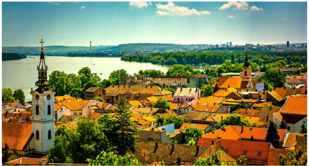
Belgrad ist eine Stadt im Wandel und ein immer beliebteres Reiseziel