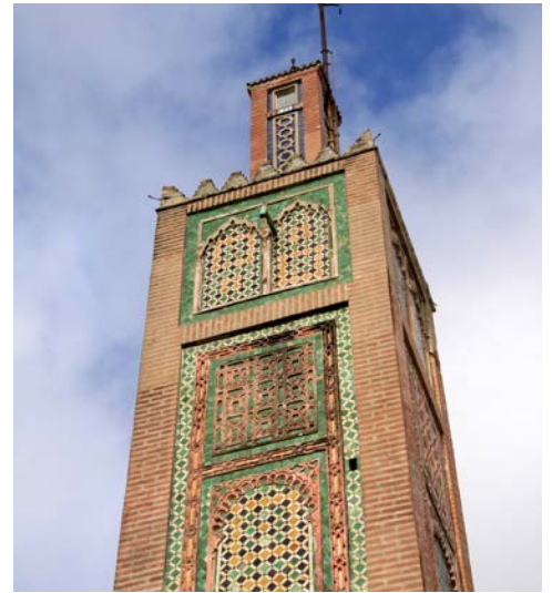
Die Große Moschee in Tanger