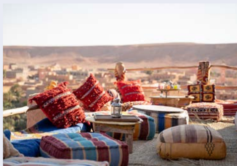
Rooftop Restaurant, Marokko