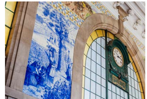
Der Bahnhof São Bento mit den beeindruckenden Azulejos

sind. Besuchen Sie die Keller, in denen die Weine viele Jahre lang reifen, bis sie ihre perfekte Balance erreichen, und lernen Sie bei einer Weinprobe, wie man die verschiedenen Aromen und Geschmacksrichtungen unterscheidet. Erfahren Sie mehr über die einzigartige Landschaft der angrenzende Region Douro-Tal und lernen Sie die Eigenschaften kennen, die diesen Wein zu etwas Besonderem und Einzigartigem machen. Nehmen Sie an einem unvergesslichen Erlebnis teil.