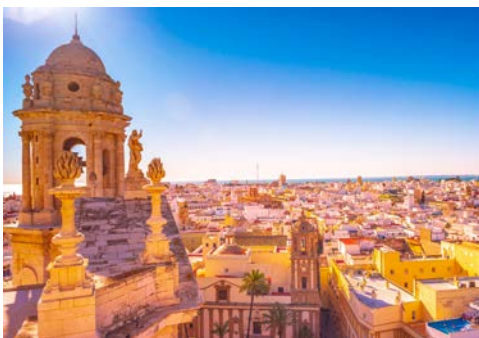
Blick auf Cádiz

Tauchen Sie ein in die märchenhaften Geschichten von 1001 Nacht – nehmen Sie den Duft des Orients auf, stürzen Sie sich in das turbulente Leben der Stadt und der marokkanischen Bazare. In Tanger öffnet sich dem Besucher das Nordwestportal Afrikas. Die Meerengenstadt in der Straße von Gibraltar besitzt große Anziehungskraft aufgrund ihrer Mischung aus christlich-spanischer und islamisch-arabischer Lebensart.