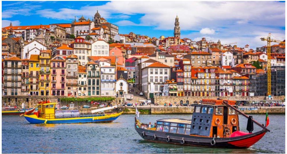
Wunderschön gelegenes Porto

Freuen Sie sich auf eine Reisekombination, die es so nur bei uns gibt. Es wäre zu schade, die wunderschöne portugiesische Stadt Porto nur zur Ein- und Ausschiffung zu nutzen. Wir laden Sie daher ein, die Stadt am Douro und ihre Umgebung näher kennenzulernen. Selbstverständlich werden Sie auch den Portwein in einer Weinkellerei kennen-, beurteilen und liebenlernen. Begeben Sie sich im Anschluss auf Ihre traumhafte Kreuzfahrt mit der Mein Schiff 4 und genießen die einzigartigen Mein Schiff® Premium -Inklusivleistungen, während Sie einmalige Häfen kennenlernen. Mehr als 700 Jahre maurischer Herrschaft haben ihre Einflüsse auf der Iberischen Halbinsel hinterlassen. Entdecken Sie pittoreske Städte, prachtvolle Bauwerke und Kulturschätze sowie die eindrucksvolle Schönheit Portugals, des sonnigen Andalusiens und des Königreichs Marokko sowie Gibraltar mit ihrem berühmt-berüchtigten Affenfelsen.