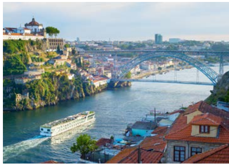
Erkunden Sie die zahlreichen Brücken

Am Flughafen werden Sie von Ihrer Deutsch sprechenden Reiseleitung empfangen und zum Hotel begleitet. Am Abend erwartet Sie ein gemeinsames 3-Gang-Menü mit begleitenden Getränken. Übernachtung im Hotel.