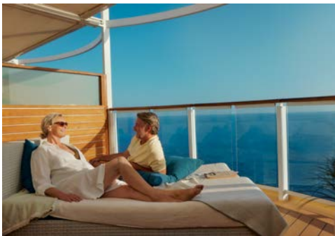
Herzlich willkommen an Bord der Mein Schiff 4