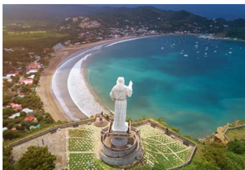
San Juan Del Sur

Der Küstenort San Juan Del Sur liegt im Südwesten Nicaraguas am Pazifik und ist eines der beliebtesten Reiseziele des Landes. Entdecken Sie mit dem breiten Angebot an Aktivitäten und Touren lokale Boutiquen, leckeres Essen und tolle Landschaften. Egal, ob Sie mit Pferden durch den üppigen Wald reiten oder auf einem Katamaran durch das smaragdgrüne Wasser gleiten, in San Juan Del Sur findet jeder sein Stückchen Paradies.