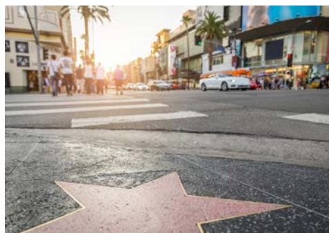
Der „Walk of Fame“

Nach dem Frühstück starten Sie frisch gestärkt zu einer halbtägigen Stadtrundfahrt und entdecken Downtown mit der Olvera Street, wo Los Angeles seinen Anfang nahm. Sie sehen außerdem die supermoderne Disney-Konzerthalle, die durch ihr außergewöhnliches Design besticht. Weiter geht es in den wohl berühmtesten Stadtteil von Los Angeles, nach Hollywood. Hier sehen Sie unter anderem das bekannte Grauman's Chinese Theater, wo Sie die Hand- und Fußabdrücke der Filmstars bewundern können. Spazieren Sie über den „Walk of Fame“ und versuchen Sie, den Stern Ihres Lieblingsstars zu finden. Sie fahren durch die Villenstadt Beverly Hills, wo zahlreiche Filmgrößen ihre luxuriösen Wohnsitze haben. Ihre Stadtrundfahrt endet am Hafen wo Sie die NORWEGIAN JEWEL zur Einschiffung erwartet.