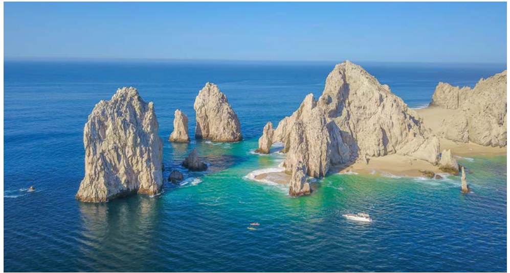
Cabo San Lucas