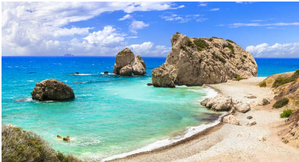
Felsen der Aphrodite