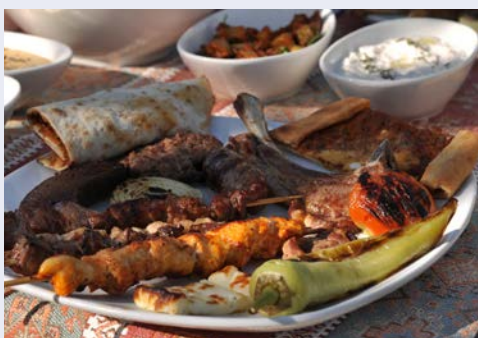
Zypriotische Meze – echte Köstlichkeiten