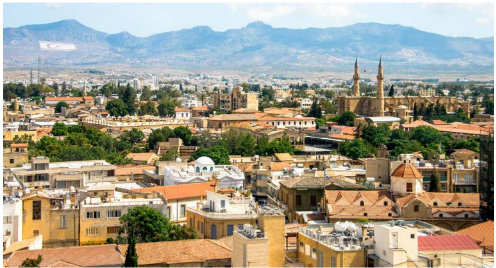
Blick über Nikosia

Genießen Sie die Schönheiten der südlichsten Mittelmeerinsel mit einer Gruppe von gleichgesinnten Alleinreisenden – traumhafte Strände, schroffe Küsten und waldreiche Gebirgszüge bieten einzigartige Naturpanoramen. Darüber hinaus wird diese Reise auch zu einer besonderen Begegnung mit der traditionellen Gastfreundschaft der Zyprioten, deren Heimat auf eine lange Kulturgeschichte zurückblickt. Das abwechslungsreiche Ausflugsprogramm führt u.a. in die Hauptstadt Nikosia, die wie die gesamte Insel in die Republik Zypern und den türkisch besetzten Teil gespalten ist. Bemerkenswert sind auch die antiken römischen Überreste in Paphos sowie zahlreiche mystische Klosteranlagen. Daneben lernen Sie sich untereinander den unterschiedlichen Verkostungen & Workshops inkl. Kochkurs besser kennen – schließlich macht es gemeinsam viel mehr Spaß! „Kopiaste“ – Willkommen auf Zypern!