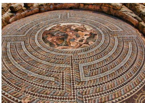
Römische Villen in Paphos: Fußboden-Mosaik

tu Romiou, wo der Sage nach Aphrodite aus dem Schaum des Meeres geboren wurde. Gemeinsam stoßen Sie mit einem Gläschen Sekt auf die Reise an.