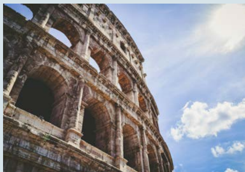
Kolosseum in Rom

In Klammern angegebene Orte sind voraussichtliche Anlegehäfen, ggf. Tenderhäfen. Eine Routenänderung und damit verbundene Ausflugsmöglichkeiten bleibt durch behördliche und lokale Gegebenheiten stets vorbehalten.