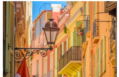
Die Altstadt von Monaco