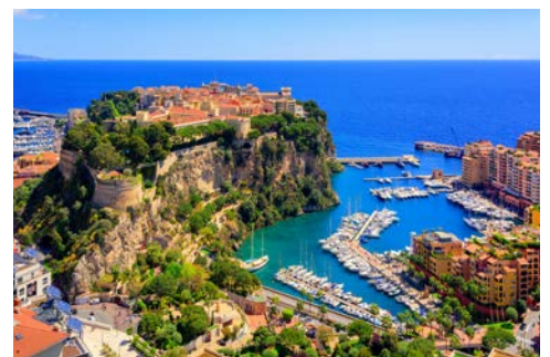
Blick auf den Palast in Monaco