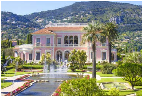
Die Villa Ephrussi de Rothschild

Am Vormittag statten Sie dem Casino Monte Carlo einen Besuch ab. Im Rahmen einer Führung tauchen Sie ein in die Welt des Glücksspiels. Mit seiner James-Bond-Atmosphäre und seiner Architektur aus der Belle Epoque beeindruckt die Spielbank die Besucher.