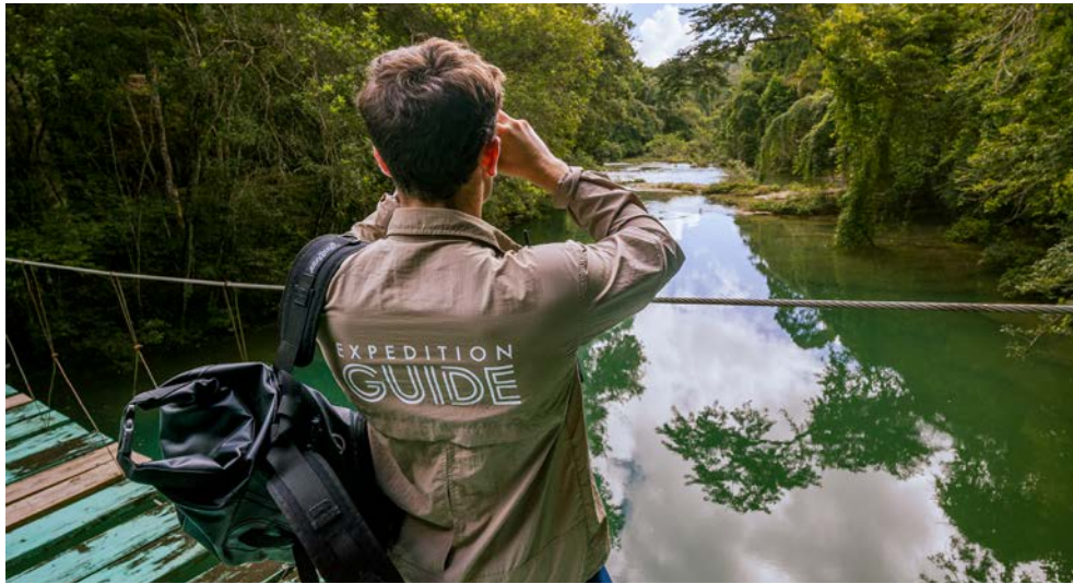
Erkunden Sie die einzigartige Natur

Meeresgründe berühmt und ein beliebtes Reiseziel für Angler. Sie zieht zahlreiche erfahrene Taucher an, um die „Astove-Mauer“ zu erkunden, eine 40 Meter tiefe Korallenwand , an der eine Vielfalt von Fischen und Suppenschildkröten zu beobachten sind.