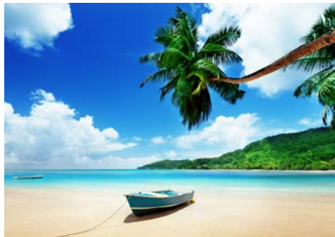
Weißer Sandstrände auf Victoria

Nach dem Frühstück haben Sie noch Zeit sich ein wenig in Ihrem Hotel zu entspannen, bevor ein Transfer Sie zur Einschiffung auf die LE BOUGAINVILLE bringt. Willkommen an Bord!