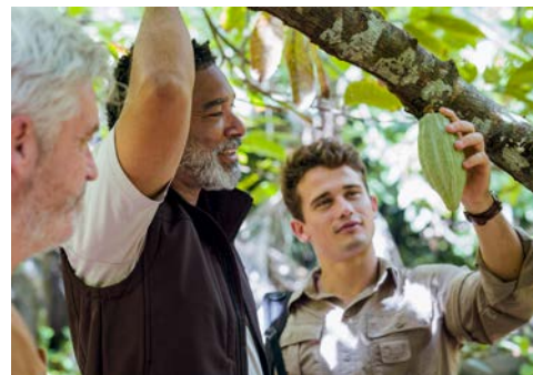
Erfahren Sie mehr über den Anbau auf der Insel

Pemba, die zweitgrößte Insel des Sansibar-Archipels, ist eine Insel der Verführung, des Staunens und der Faszination. Lassen Sie sich vom Gesang der Inselfrauen verzaubern, wenn sie bei Ebbe an den Sandstränden Rotalgen sammeln. Ein einmaliges, zauberhaftes Schauspiel! Eine hügelige Landschaft mit fruchtbaren Böden und wenig besuchte, unberührte Küstenabschnitte prägen die „ Grüne Insel “. Eine üppige Vegetation mit Bananenstauden, Kokospalmen, Nelken- und Muskatbäumen sorgt für die einheimische Gewürzproduktion, für die die Insel berühmt ist.