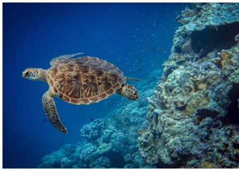
Beeindruckende Unterwasserwelten warten auf Sie

Meeresgründe berühmt und ein beliebtes Reiseziel für Angler. Sie zieht zahlreiche erfahrene Taucher an, um die „Astove-Mauer“ zu erkunden, eine 40 Meter tiefe Korallenwand , an der eine Vielfalt von Fischen und Suppenschildkröten zu beobachten sind.