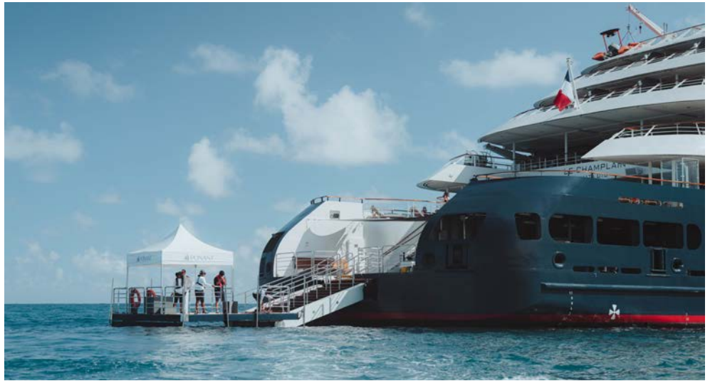
Die Marina erleichtert Ihnen überall einen einfachen Ein- und Ausstieg

Freuen Sie sich auf eine 13-tägige Expeditions-kreuzfahrt durch den Indischen Ozean an Bord der LE BOUGAINVILLE. Erleben Sie wunderschöne Natur, eine außergewöhnliche Tierwelt und geschichtsträchtige Orte des UNESCO-Welterbes. Ihre Traumreise beginnt auf den Seychellen. Von Victoria geht es für Sie zuerst nach La Digue: Hier erwartet Sie eine wahre Postkarten-landschaft mit Palmen, Granitfelsen, weißem Sand und kristallklarem Wasser. Sie fahren weiter zum traumhaften Saint-François-Atoll und entdecken anschließend das Aldabra-Atoll, ein unberührtes Schutzgebiet, das zum UNESCO-Weltnaturerbe gehört. Danach warten noch die kleine Insel Astove, die wunderschöne Insel Assomption und schließlich die Wunder Tansania auf Sie. Diese fabelhafte Reise endet schließlich vollgepackt mit neuen Eindrücken im wunderschönen Sansibar.