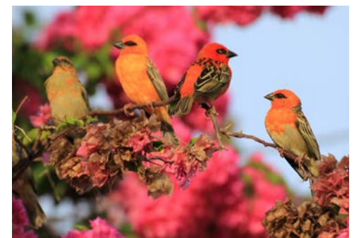
Kardinal Vögel – auch bekannt unter den Namen „Taroza“

Das riesige Aldabra-Atoll im Südwesten der Seychellen gilt als eine der ursprünglichsten Regionen der Erde. Hier ist die weltgrößte Kolonie von Riesenschildkröten zuhause, ebenso wie zahlreiche Vogelarten wie beispielsweise die Bindenfregattvögel. Das kreisförmige, leicht erhöhte Atoll gehört zum UNESCO-Welterbe . Seine vier Koralleninseln sind durch enge Passagen voneinander getrennten und umschließen eine niedrige Lagune . Freuen Sie sich auf ein spektakuläres Naturerlebnis. Entdecken Sie dieses Atoll mit türkisblauem Wasser , das von Mangroven und feinen Sandstränden gesäumt ist, ein ökologisches Wunder ohne Gleichen und ein ästhetisch perfekter biologischer Schatz.