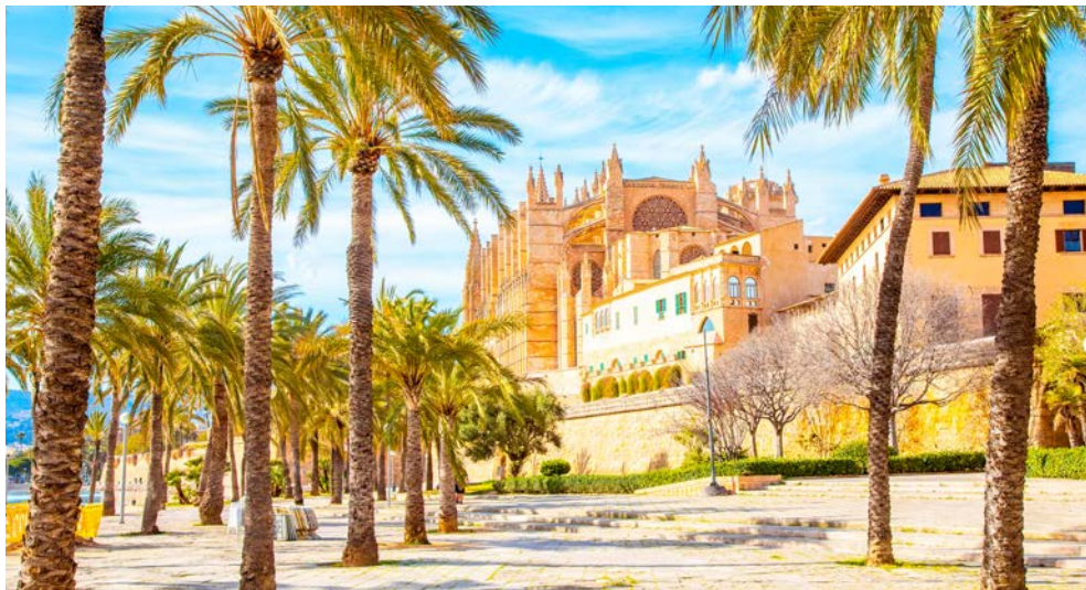
Blick auf die Kathedrale in Palma de Mallorca