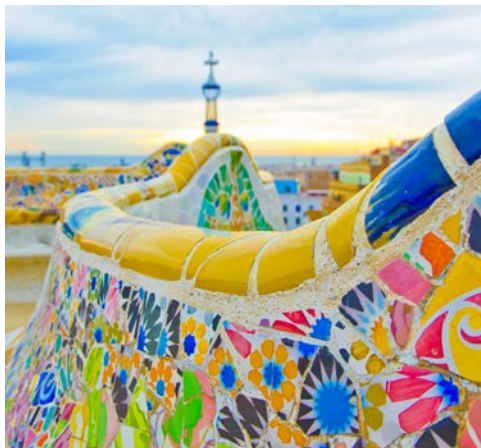
Park Güell in Barcelona

Die Hauptstadt Kataloniens, Barcelona, begrüßt Sie heute. Spazieren Sie ein wenig entlang des berühmten Boulevards, die Rambla, schauen Sie in die verwinkelten und interessanten Gässchen des Gotischen Viertels und ein Besuch der Sagrada Familia lohnt alle mal. Wer möchte, hat weiter die Möglichkeit, die Kunstwerke von Antoni Gaudí kennen zu lernen, der Park Güell und das Casa Batlló lohnen für einen Stopp.