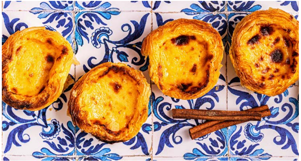
Probieren Sie unbedingt die kleinen Törtchen „Pastéis de Nata“

Die Reise beginnt mit zwei Nächten in Lissabon. Lernen Sie die Hauptstadt Portugals richtig kennen. Genießen Sie typischen Pasteis de Nata oder schauen Sie sich die vielen Sehenswürdigkeiten an, die diese geschichtsträchtige Stadt zu bieten hat. Auf dem Weg zum Schiff machen Sie noch eine Stadtrundfahrt, bevor Ihre Reise an Bord der Norwegian Viva weitergeht. Entspannte Tage durch das Mittelmeer warten nun auf Sie. Kosten Sie leckere Tapas, besuchen Sie die einzigartige Sagrada Familia in Barcelona, tauchen Sie ein in die spektakulären Naturlandschaften der Provence, während Sie das wunderschöne Marseille und den Papstpalast zu Avignon besichtigen. Bestaunen Sie Livorno an der Westküste der Toskana, wo die pastellfarbenen Küstendörfer der Cinque Terre in der Sonne leuchten.