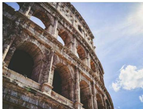
Baukunst der Vergangenheit – Kolosseum in Rom

Bei 2.500 Jahren voller Geschichte, Kunst und Kultur ist es kein Wunder, dass Rom eine der meistbesuchten Städte der Welt ist. Bei einer Stadtrundfahrt durch Rom endend am Flughafen betrachten Sie die Meisterwerke des Vatikans und machen eine Reise in die Vergangenheit.