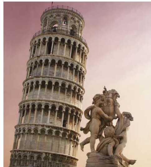
Der schiefe Turm von Pisa – einen Besuch wert