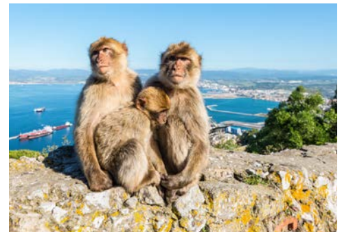
Der bekannte „Affenfelsen“

Das charmante Lissabon ist mit den gotischen Kathedralen, mittelalterlichen Schlössern und malerischen Vierteln eine der größten Attraktionen Portugals – und Landeshauptstadt seit 1147. Genießen Sie den Panoramablick vom Park Eduardo VII aus, weiter geht es durch die Avenida Liberdade und Praça do Comercio (Handelsplatz) zum Fluss Tejo. Sie besuchen die Altstadt Alfama und das Stadtviertel Belém. Von hier stachen einst die Seefahrer in See, um Schiffsfahrtswege nach Ostafrika, Brasilien oder Indien zu erkunden. Sie besuchen das Denkmal der Entdeckungen sowie den nicht weit entfernt stehenden Torre de Belém an der Mündung des Tejo. Ein weiterer Höhepunkt ist die Besichtigung des Nationalpalasts von Ajuda, ein neoklassizistisches Gebäude aus der ersten Hälfte des 19. Jh. Anschließend fahren Sie zum Hafen, wo die Norwegian Viva bereits zur Einschiffung auf Sie wartet. Am Nachmittag heißt es „Leinen los“ und Ihre fantastische Kreuzfahrt beginnt.