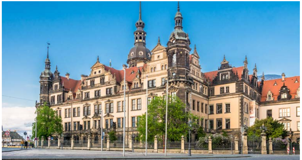
Machen Sie eine Zeitreise im Grünen Gewölbe