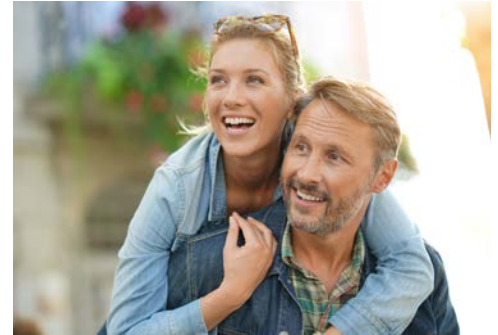
Verbringen Sie ein paar schöne Tage in Dresden

Im Laufe des Tages erfolgt Ihre Bahnreise in der 1. Klasse von Ihrem Heimatbahnhof nach Dresden. Dort angekommen erreichen Sie Ihr Hotel nach einer kurzen Taxi-Fahrt (nicht inklusive) in nur wenigen Minuten. Nachdem Sie sich in Ihrem Zimmer eingerichtet haben, begrüßt Sie Ihre Reiseleitung um ca. 18 Uhr im Hotel. Als Einstimmung auf die vor uns liegenden Tage erwartet Sie dann ein Dreigänge-Menü im hervorragenden Restaurant des Hotels (Getränke nicht inklusive). Vielleicht lassen Sie den ersten Abend dann an der Hotelbar gemütlich ausklingen.