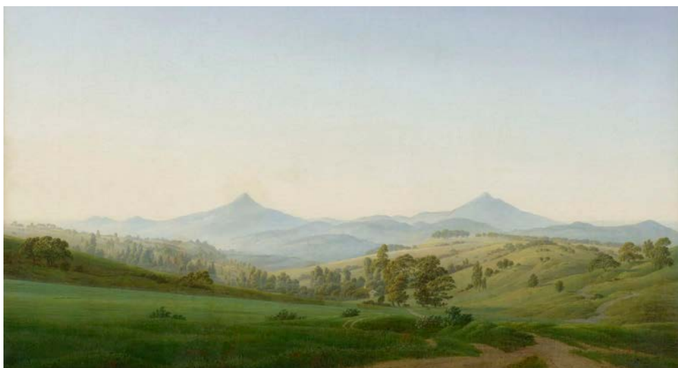
Caspar David Friedrich – Böhmisches Landschaft mit dem Milleschauer

...ist eine deutsche Oper in zwei Akten von Wolfgang Amadeus Mozart. Die Oper ist eine Mischung aus Märchen, Symbolismus und Freimaurer-Ideen und erzählt die Geschichte von Prinz Tamino, der beauftragt wird, die Tochter der Königin der Nacht, Pamina, aus den Händen des bösen Sarastro zu befreien. Unterstützt von seinem Freund Papageno und mit Hilfe einer magischen Flöte und eines Glockenspiels durchläuft Tamino Prüfungen und erlebt Abenteuer. Die Oper behandelt Themen wie Liebe, Freundschaft, Mut und Weisheit und ist berühmt für ihre einprägsame Musik, darunter die Arien »Der Hölle Rache kocht in meinem Herzen« und »Dies Bildnis ist bezaubernd schön«.