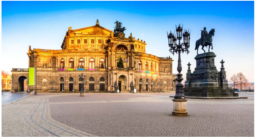
Erleben Sie die Vorstellung "Die Zauberflöte" in der Semperoper

Deutschland feiert in diesem Jahr Caspar David Friedrich und ehrt einen der größten deutschen Künstler mit einem vielfältigen Veranstaltungsreigen. Den Abschluss der zahlreichen Sonderveranstaltungen bildet eine große Sonderausstellung im Albertinum Dresden. Unter dem Titel »Caspar David Friedrich. Wo alles begann« zeigt das Albertinum Dresden zahlreiche Werke des größten Romantiker aller Zeiten. Nach großen Sonderausstellungen in Hamburg, Greifswald und Berlin, sicherlich ein gebührender Abschluss der Feierlichkeiten zum 250. Geburtstag. Darüber hinaus hat Dresden viel zu bieten: Frauenkirche und Alte Meister, Grünes Gewölbe und Semperoper, barocke Altstadt und moderne City – die sächsische Landeshauptstadt begeistert als Gesamtkunstwerk und empfängt ihre Besucher mit einer Fülle an bekannten Sehenswürdigkeiten. Entdecken Sie den außergewöhnlichen Charme der auch als Elbflorenz bezeichneten Stadt! Perfekter Ausgangspunkt ist das Steigenberger Hotel de Saxe im Herzen der Dresdener Altstadt. Von hier aus lassen sich nahezu alle Sehenswürdigkeiten entspannt zu Fuß erreichen. Freuen Sie sich außerdem auf die Semperoper, welche als eines der schönsten Theaterhäuser der Welt gilt. Sie ist die Heimat der Sächsischen Staatskapelle Dresden, einem der traditionsreichen Orchester der Welt, welche seit Jahrzehnten Opern-Geschichte schreibt.