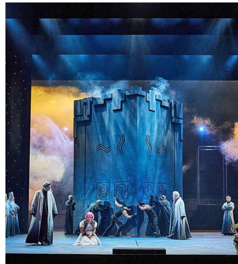
Erleben Sie »Die Zauberflöte«